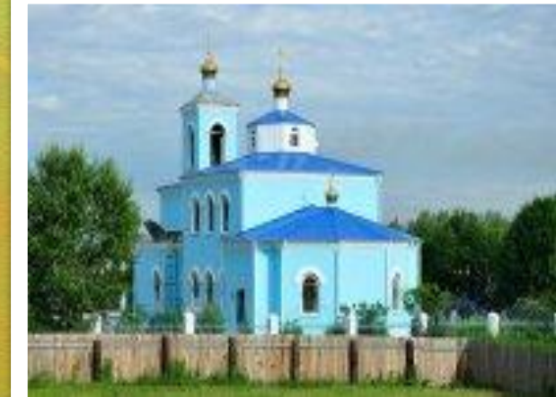
Храм Покрова Пресвятой Богородицы