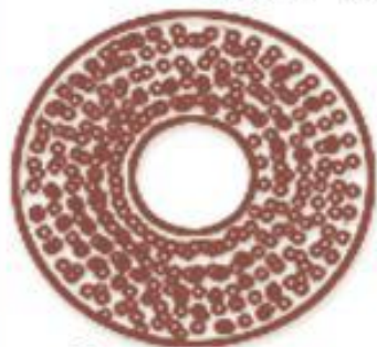
Строение шляпки снизу