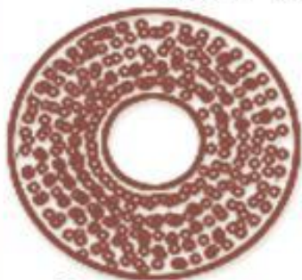
Строение шляпки снизу