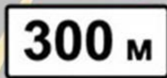
«Расстояние до объекта»