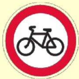
Движение на велосипедах запрещено