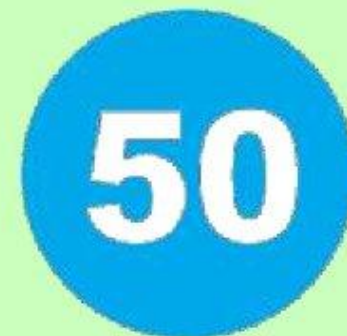
Ограничение минимальной скорости