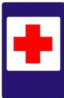
Пункт первой медицинской помощи