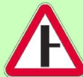
Примыкание второстепенной дороги