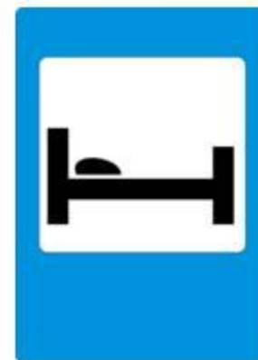
Гостиница или мотель