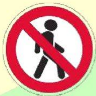
Движение пешеходов запрещено