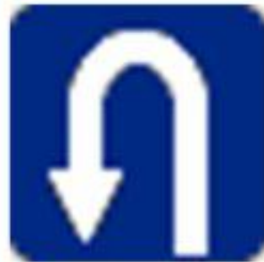
"Место для разворота"