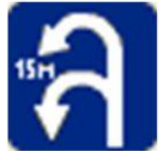
"Зона для разворота"