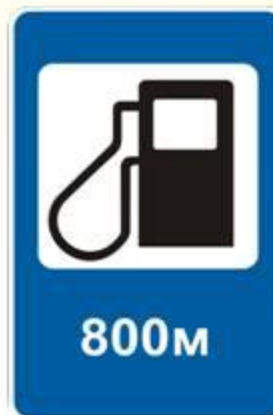
Авто – заправочная станция