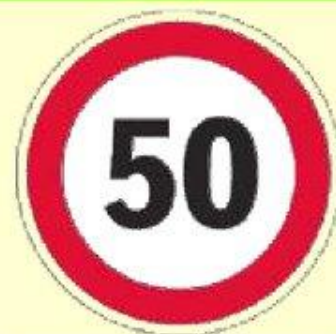
Ограничение максимальной скорости