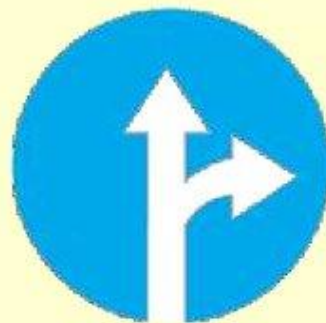
Движение прямо или направо