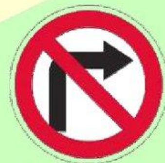
Поворот направо запрещен