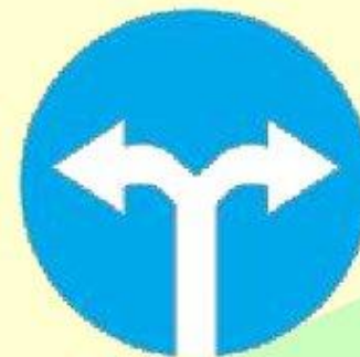
Движение направо или налево