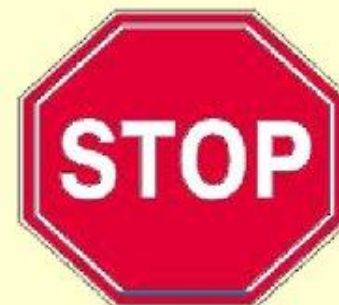
Движение без остановки запрещено