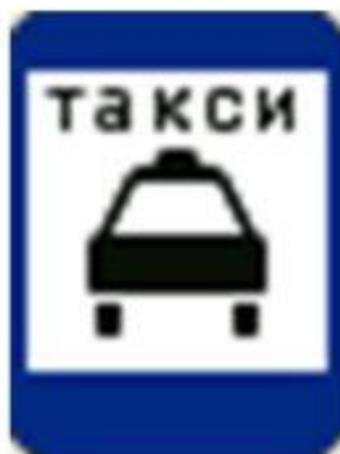
"Место стоянки легковых такси"