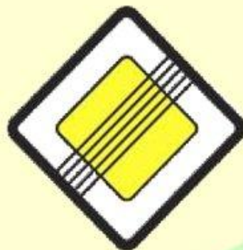
Конец главной дороги