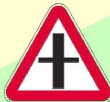
Пересечение со второстепенной дорогой