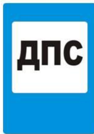
Пост дорожно – патрульной службы