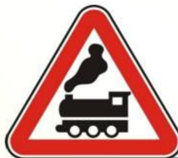
Железнодорожный переезд без шлагбаума