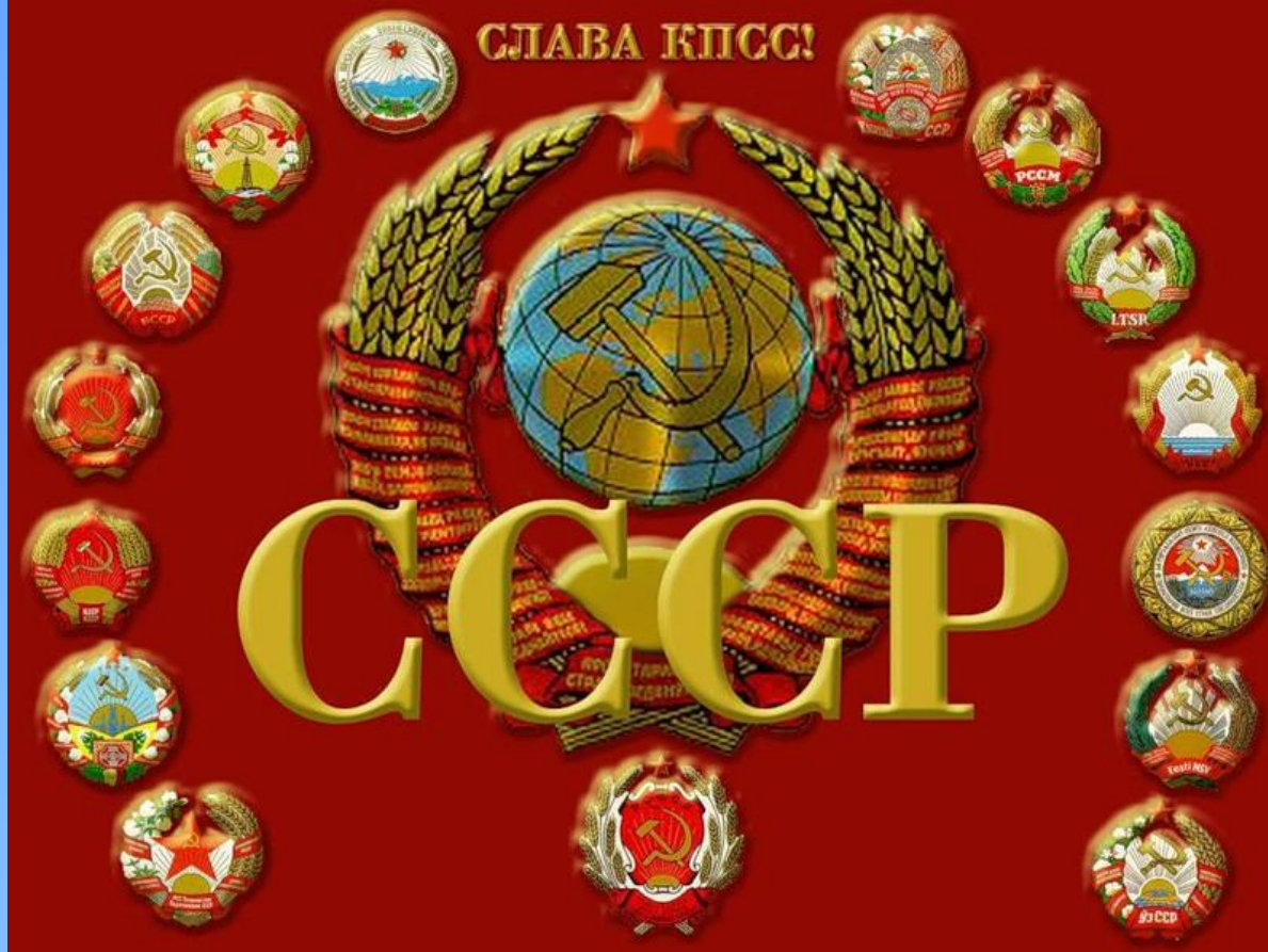
Гербы Советского Союза

А вот когда внешним силам удалось противопоставить узкокорыстные интересы предательской части правящей верхушки СССР, интересам 280-миллионного советского народа, тогда и произошла крупнейшая геополитическая катастрофа последнего времени - крушение Советского Союза. Вслед за ним рухнула и мировая система социализма.