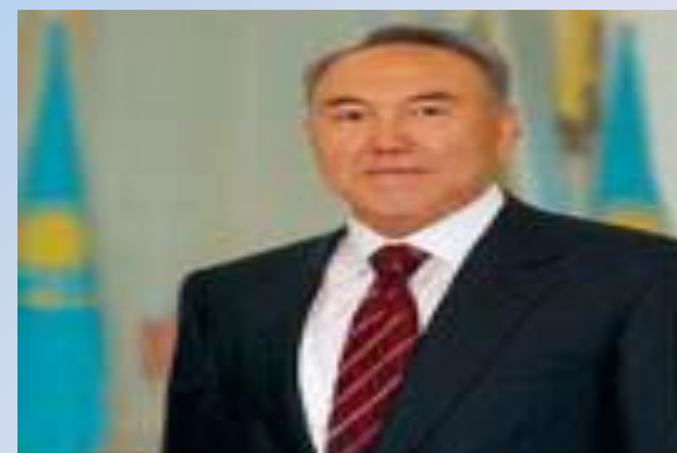
Председатель Ассамблеи народа Казахстана