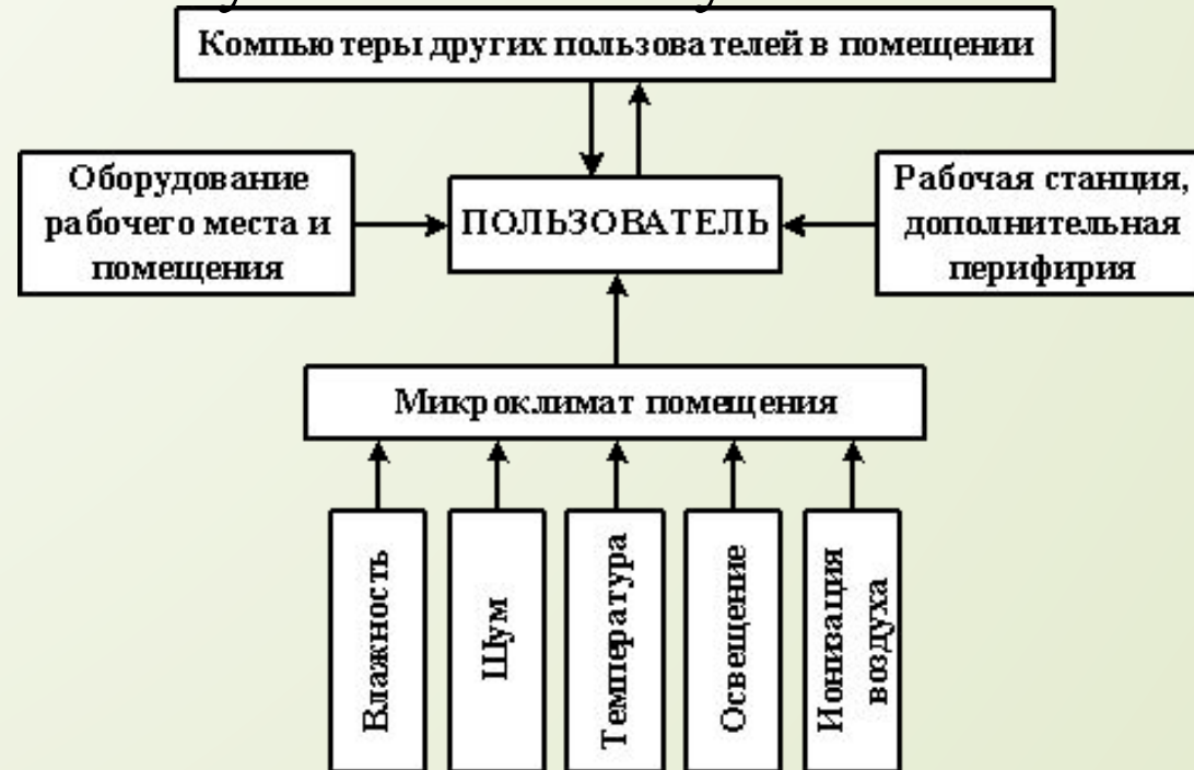
Рисунок 1 – Система взаимодействия

Вторая часть посвящена ряду общих и практических советов и рекомендаций по организации рабочего места и рабочего процесса, а также стандарты безопасности, которые бы удовлетворяли главным требованиям при работе с компьютером и способствовали бы уменьшению утомления.