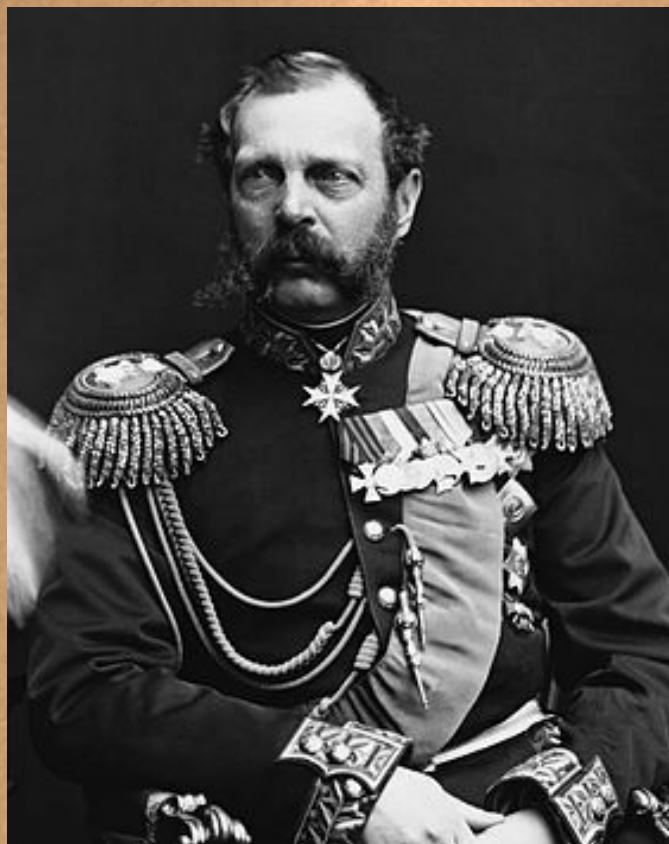
Александр II Николаевич

В середине 19 века значительные шаги в направлении конституционного правления были сделаны в царствование императора Александра II: отмена крепостного права, судебная реформа, развитие земства.