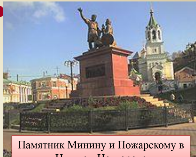
Памятник Минину и Пожарскому в Нижнем Новгороде