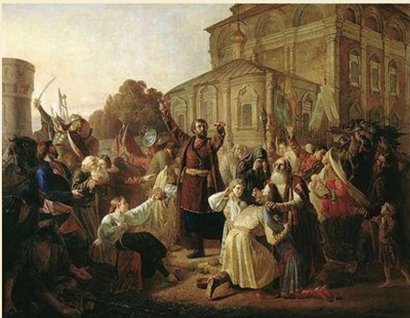
Воззвание Минина к нижегородцам в 1611 году

Инициатива организации Второго народного ополчения исходила от ремесленно-торговых людей Нижнего Новгорода, важного хозяйственного и административного центра на Средней Волге. Нижний Новгород по своему стратегическому положению, экономическому и политическому значению был одним из ключевых пунктов восточных и юго-восточных районов России.