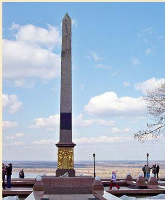
Обелиск в честь Минина и Пожарского в Нижнем Новгороде