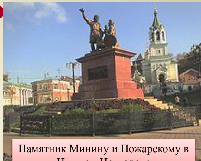
Памятник Минину и Пожарскому в Нижнем Новгороде