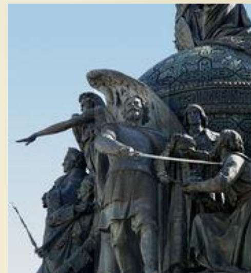
Дмитрий Пожарский на Памятнике «1000-летие России» в Великом Новгороде