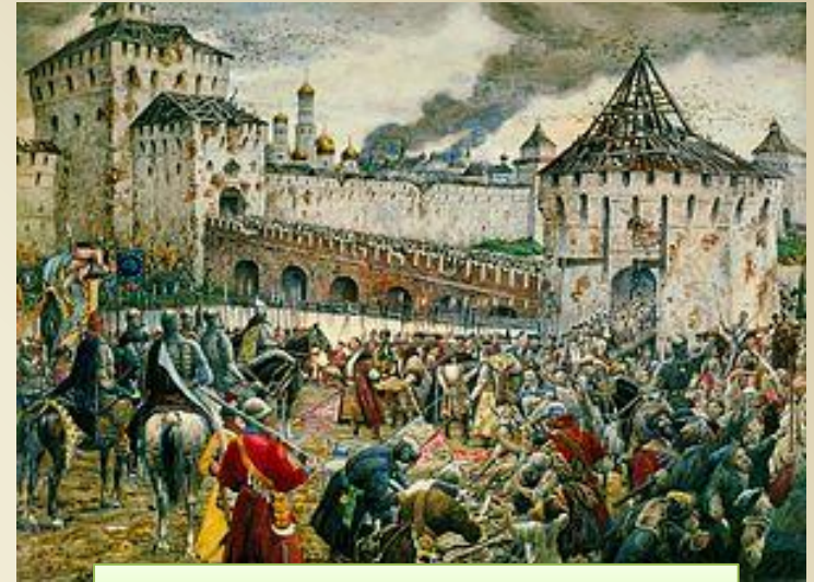
Изгнание поляков из Кремля

Пожарский предлагал осажденным свободный выход со знаменами и оружием, но без награбленных сокровищ. Они предпочли питаться пленными и друг другом, но с деньгами расставаться не желали. Пожарский с полком встал на Каменном мосту у Троицких ворот Кремля, чтобы встретить боярские семьи и защитить их от казаков. 26 октября (5 ноября) 1612 поляки сдались и покинули Кремль. 27 октября (6 ноября) 1612 был назначен торжественный вход в Кремль войск князей Пожарского и Трубецкого.