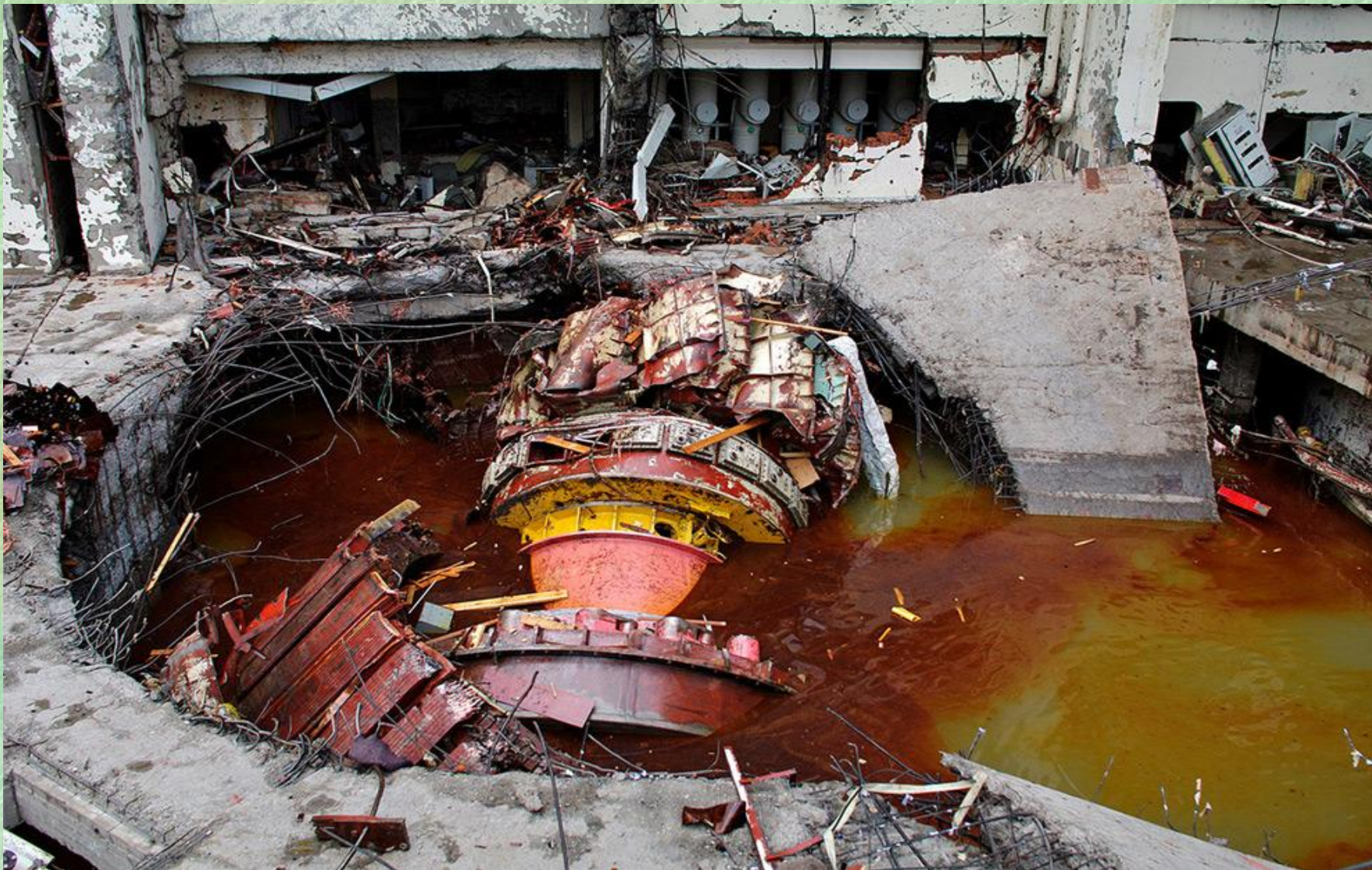
Разрушенное оборудование на Саяно-Шушенской ГЭС в понедельник 17 августа 2009 года.