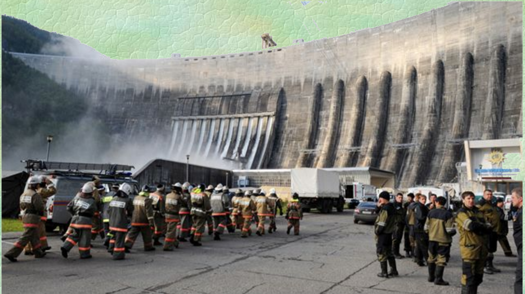
Спасатели МЧС работают на месте аварии 19 августа 2009 года.