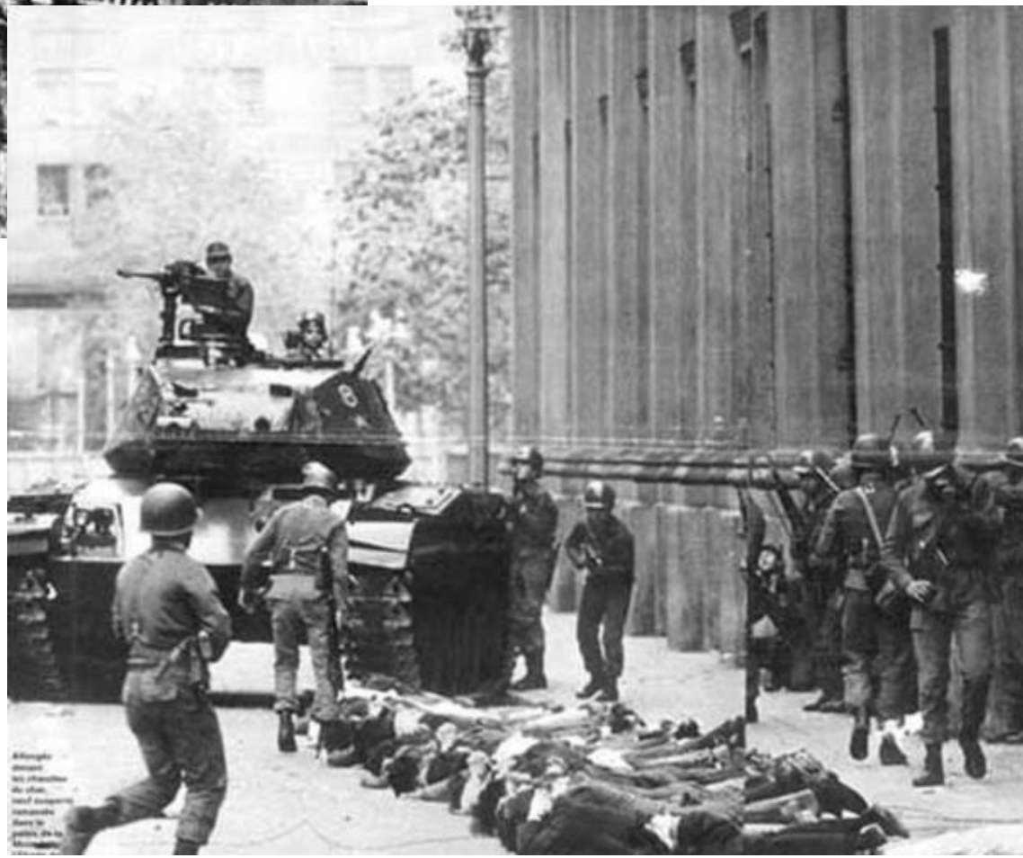
Allegedly American soldiers in the city of Hanoi after the fall of the city.