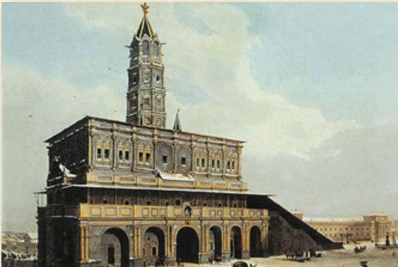
Ж-Б. Арну. Сухарева башня. 1840 г.

Книга была написана за два года и вышла в свет в 1703 г. тиражом 2400 экземпляров. По ней стали преподавать не только в Навигацкой школе, но и в Морской академии.