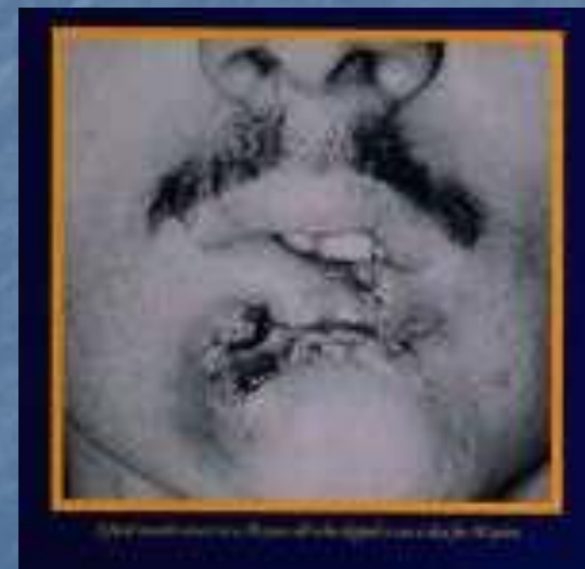
рак нижней губы