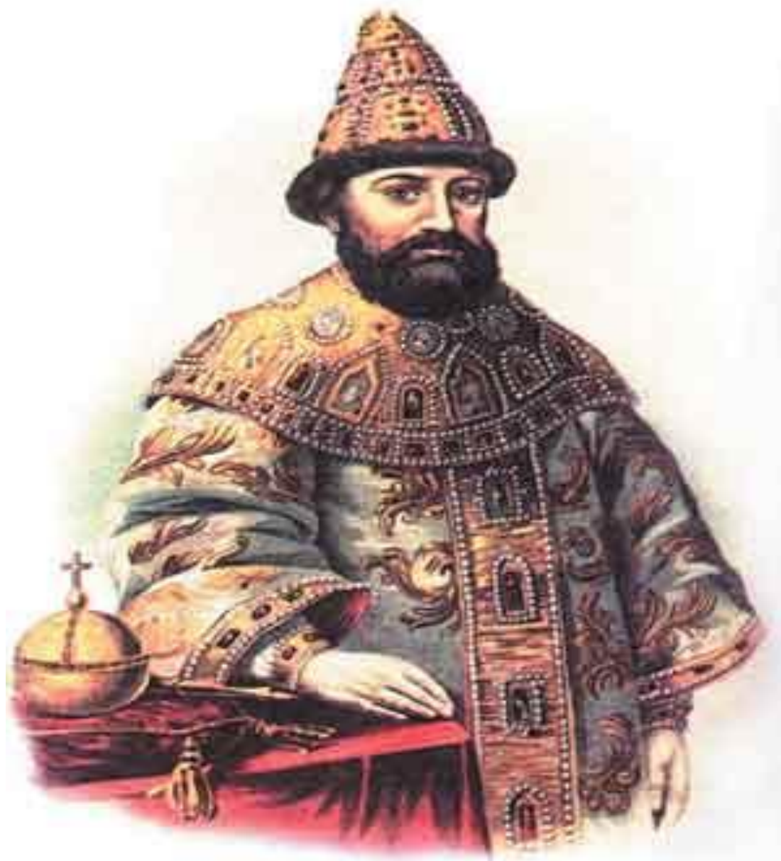
Царь Михаил Фёдорович Романов (годы правления 1613-1645)