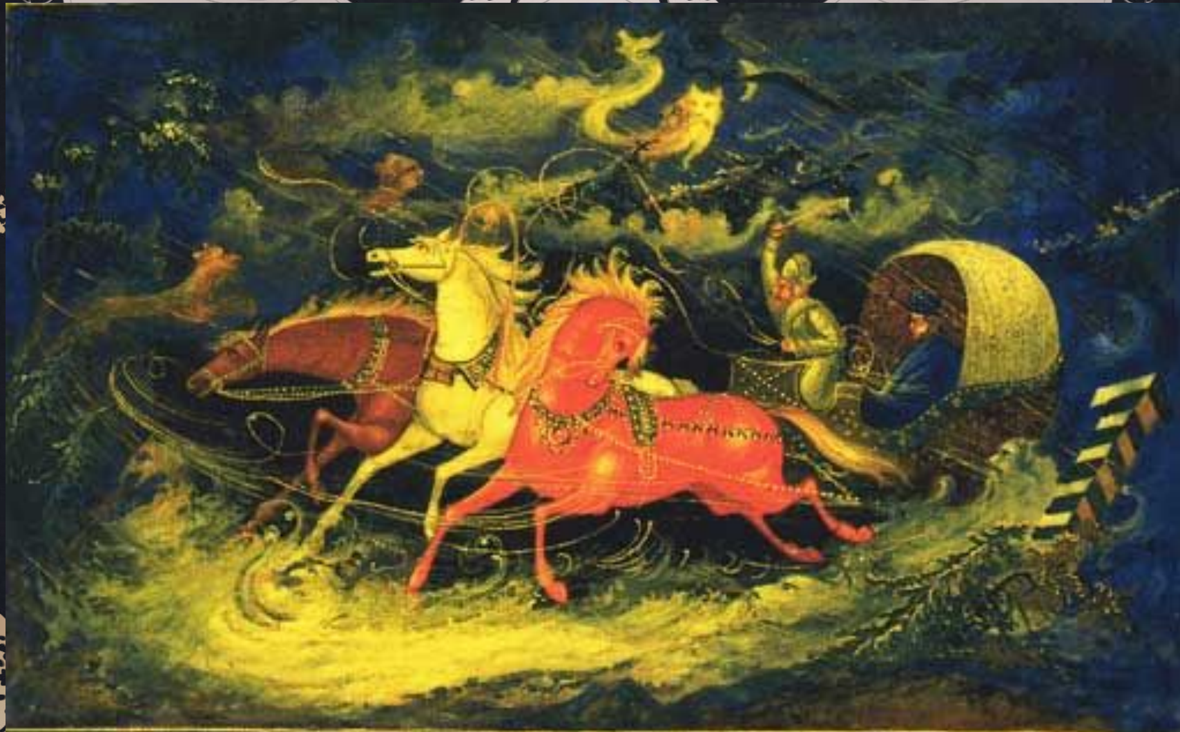
Фёдор Шилов "Бесы"