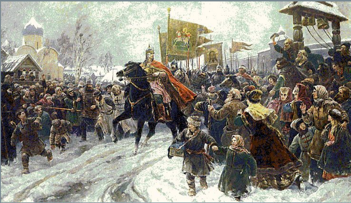
В. А. Серов. «Въезд Александра Невского во Псков»

Весной 1242 г. войско Ливонского рыцарского ордена попыталось вторгнуться в пределы русских земель. Русские дружины во главе с князем Александром Невским встретили агрессора на льду Чудского озера. Здесь 5 апреля 1242 г. произошло сражение, которое вошло в историю, под названием Ледового побоища.