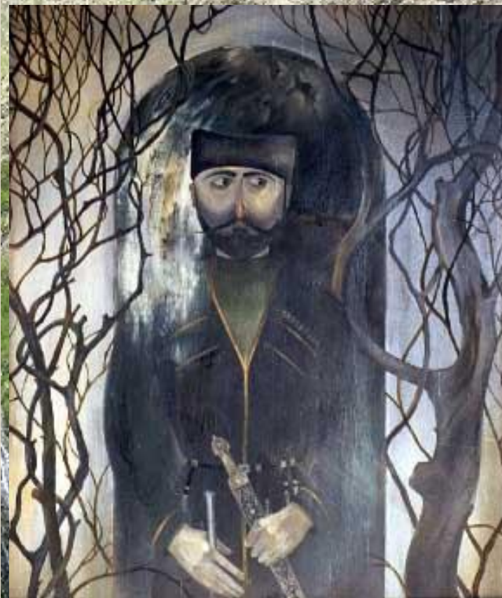
Картина Фидара Фидарова "Святой Хетаг"