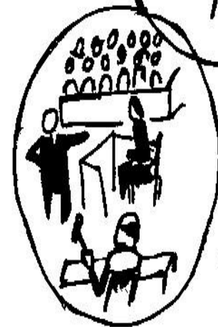
Trial by Jury