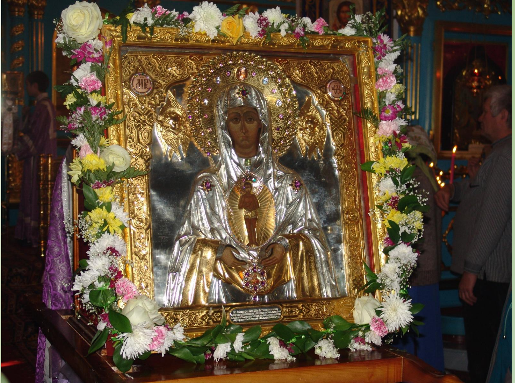
Икона Божией Матери «Слово Плоть Бысть»