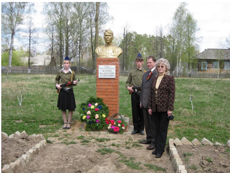
Открытие памятника Герою Советского Союза Жукову В.С.