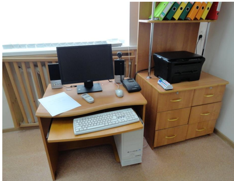
Рабочее место учителя