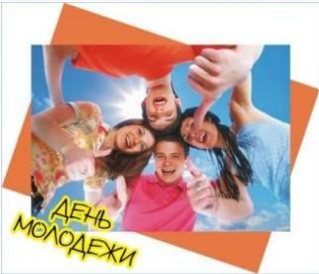
Год молодежи 2009 год