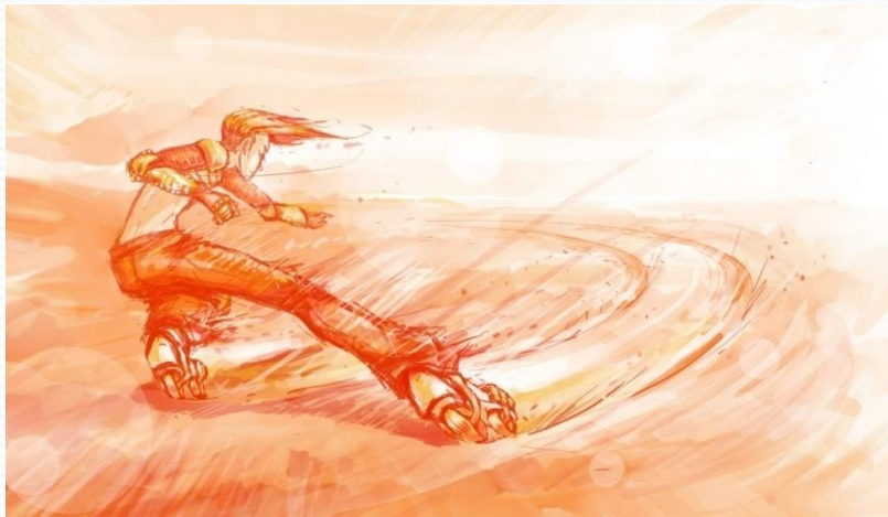
● Юлиана Фокс