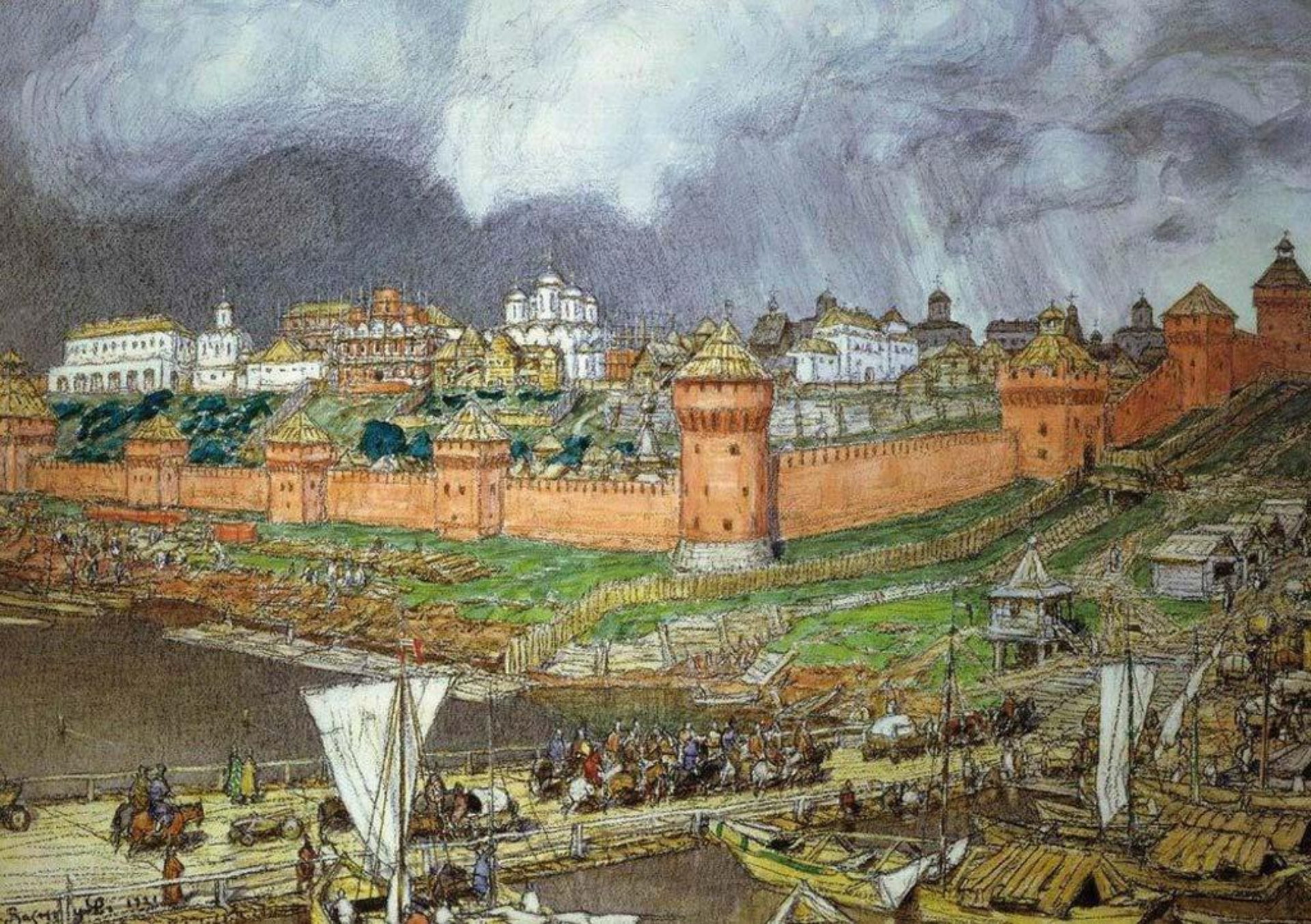
Аполлинарий Васнецов. Московский Кремль при Иване Калите