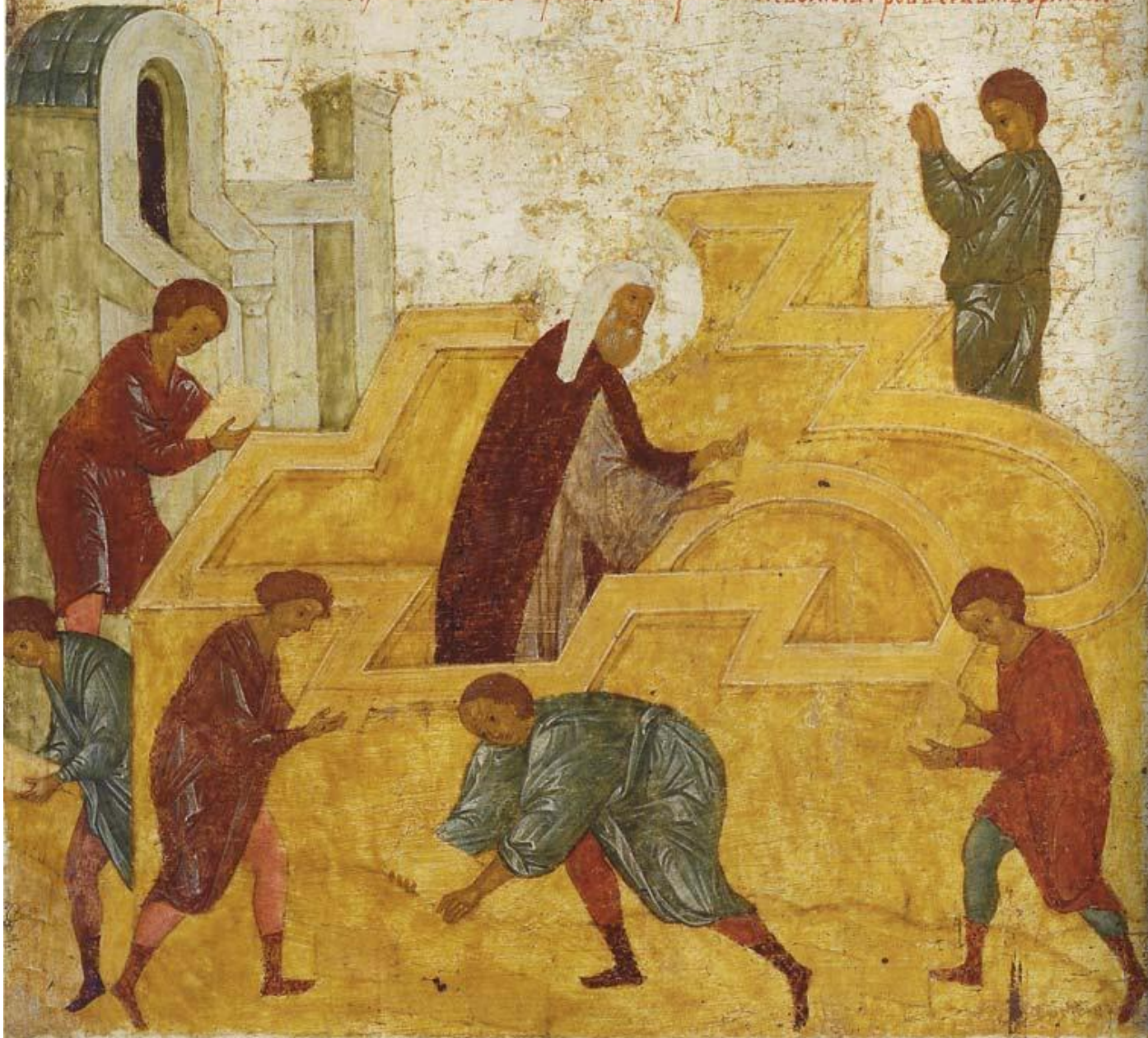
Начало строительства Успенского собора Московского Кремля. Клеймо с житийной иконы митрополита Петра. XV в.

Прійде папъ в градъ москву влжении петръ кнзю иванъ даниловичю со вѣтвѣмъ вѣтвѣмъ да сотвори црковь каменну составлену воймъ прѣтвѣца чина сѣу успеніа сіау во словеса и нзъ с радостію пріемль и нѣкоу бо начаць совершѣ стѣи рѣкама своимъ гровъ секѣ творити.