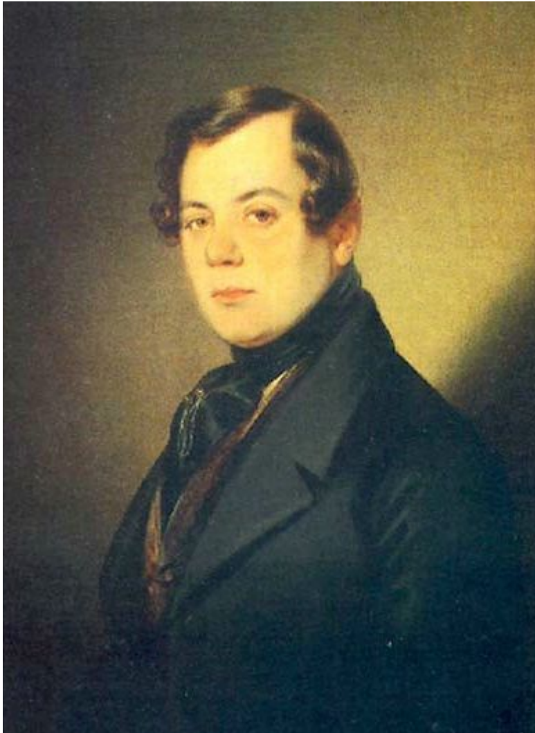
Владимир Григорьевич Бенедиктов (1807–1873)

Близко... Сердце встрепенулось; Ближе... ближе... Вот видна! Вот раскрылась, развернулась, — Храмы блещут: вот она! Вот — она! Давно ль из пепла? А взгляните: какова! Встала, выросла, окрепла И по-прежнему жива! И кресты церквей далече, В радость сердцу и очам, Идут в золоте навстречу Золотым небес лучам. И спокойный, величавый, Бодрый сторож русской славы — Кремль — и красен, и велик, — И светла, златовенчанна Колокольня Иоанна Движет звучный свой язык; Только с бурей поборолась — Глядь! Опять в лучах горит И во весь свой медный голос С Божьим небом говорит.