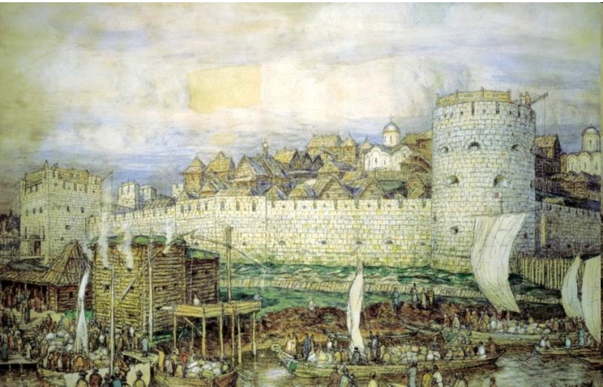
Аполлинарий Васнецов. Московский Кремль при Димитрии Донском