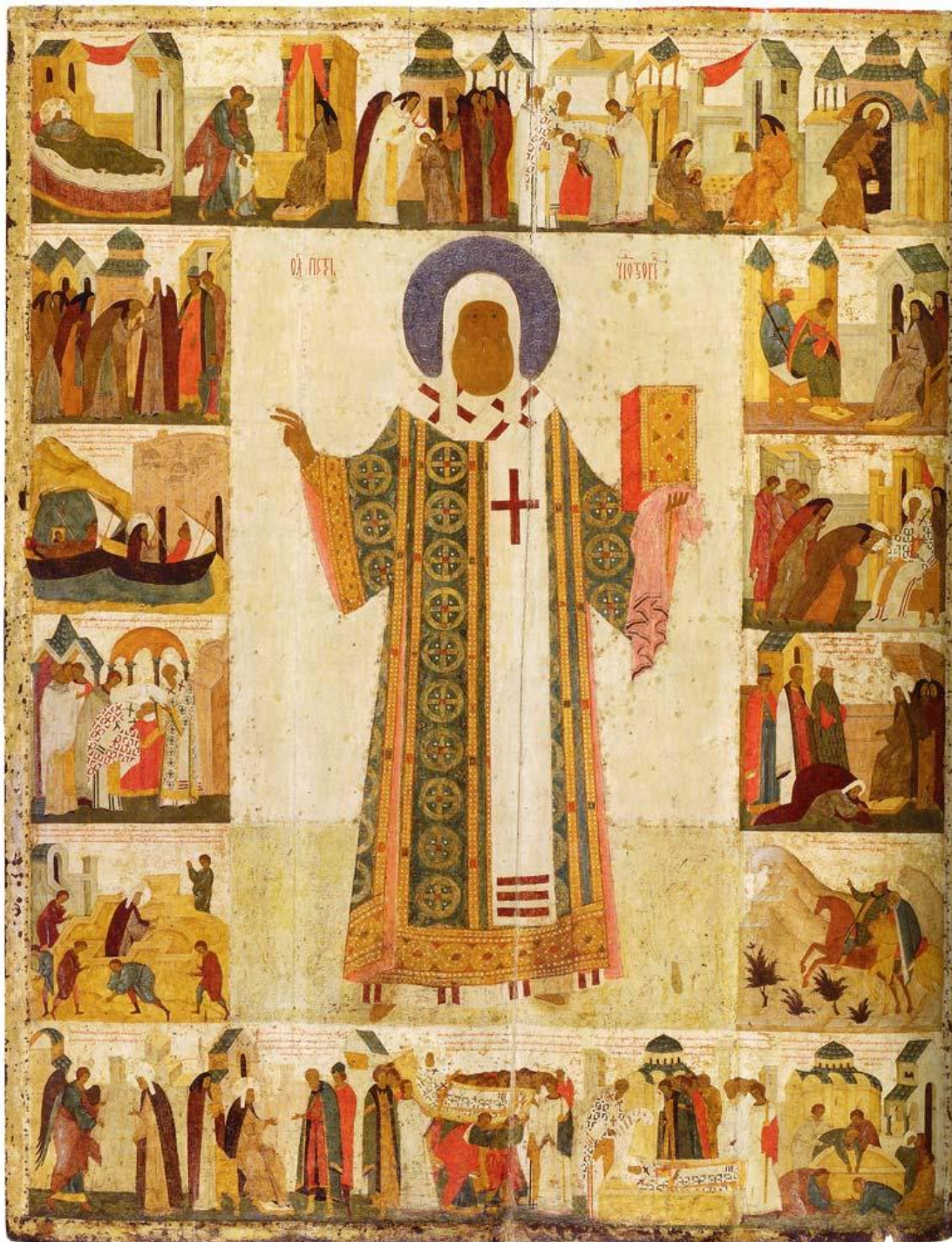
Митрополит Петр. Житийная икона. XV в.