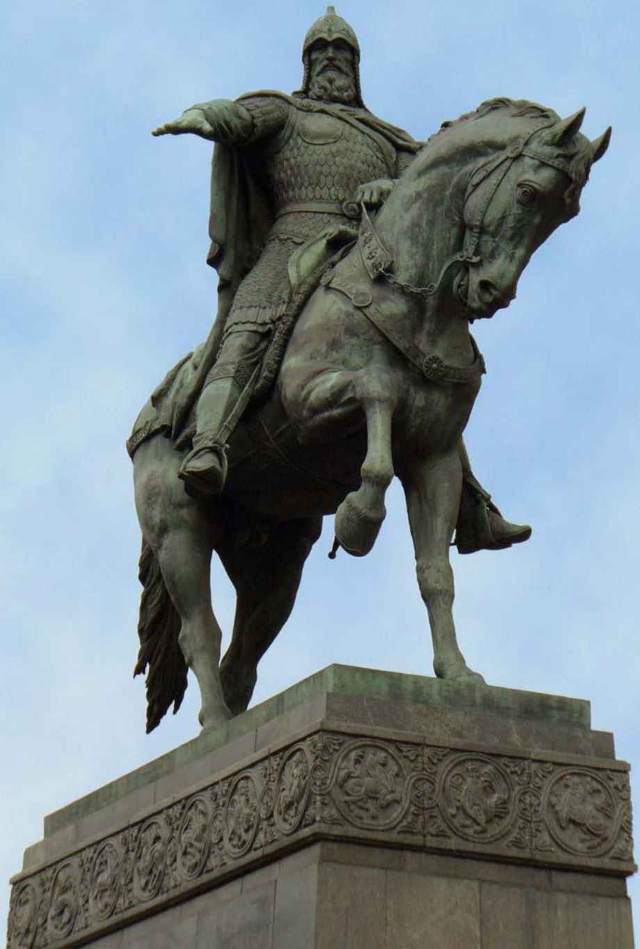
Памятник князю Юрию Долгорукому. Москва