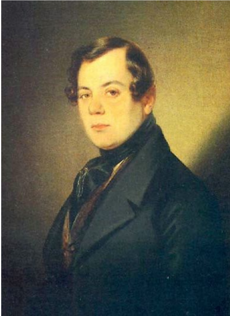
Владимир Григорьевич Бенедиктов (1807–1873)

Близко... Сердце встрепенулось; Ближе... ближе... Вот видна! Вот раскрылась, развернулась, — Храмы блещут: вот она! Вот — она! Давно ль из пепла? А взгляните: какова! Встала, выросла, окрепла И по-прежнему жива! И кресты церквей далече, В радость сердцу и очам, Идут в золоте навстречу Золотым небес лучам. И спокойный, величавый, Бодрый сторож русской славы — Кремль — и красен, и велик, — И светла, златовенчанна Колокольня Иоанна Движет звучный свой язык; Только с бурей поборолась — Глядь! Опять в лучах горит И во весь свой медный голос С Божьим небом говорит.