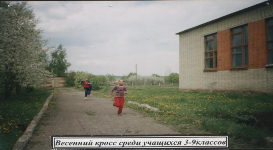
Весенний кросс среди учащихся 3-9 классов