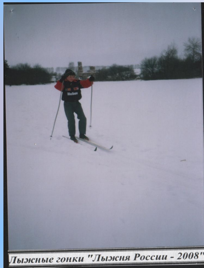
Лыжные гонки "Лыжня России - 2008"