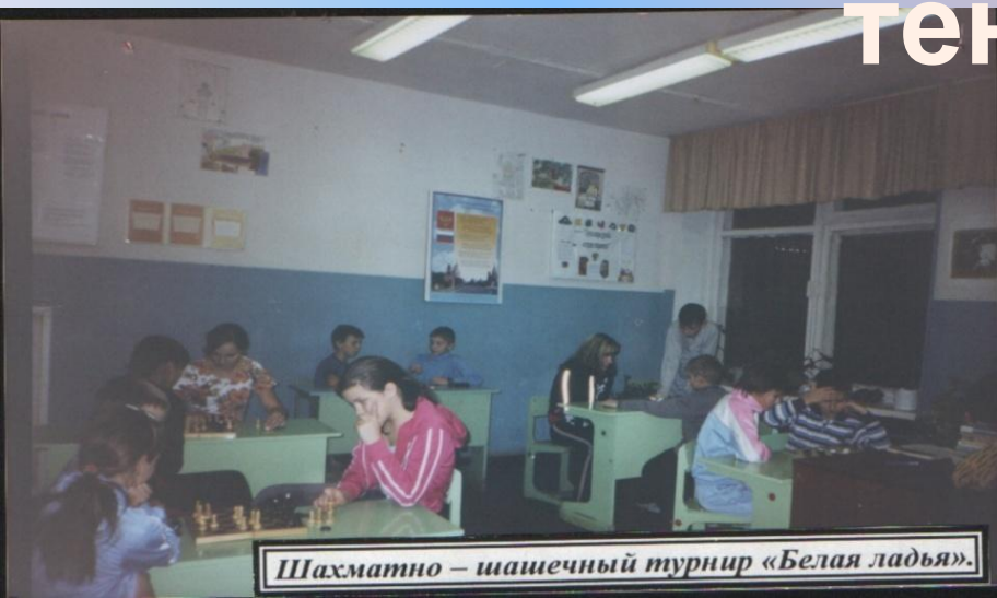
Шахматно – шашечный турнир «Белая ладья».

Дети любят прыгать, играть в волейбол, шашки, настольный теннис.