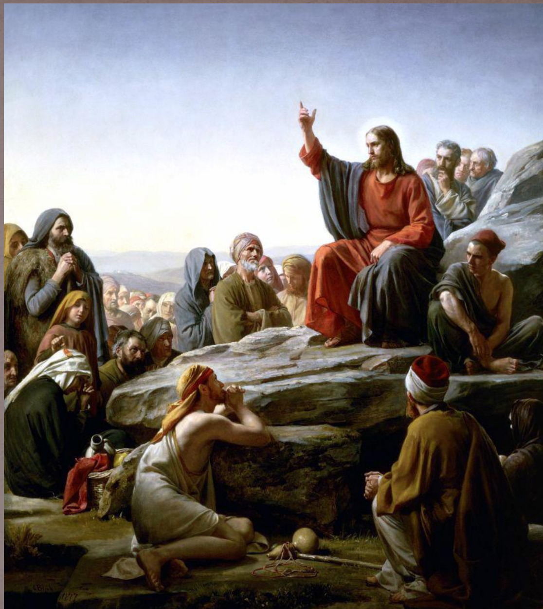
Нагорная проповедь. Карл Генрих Блох