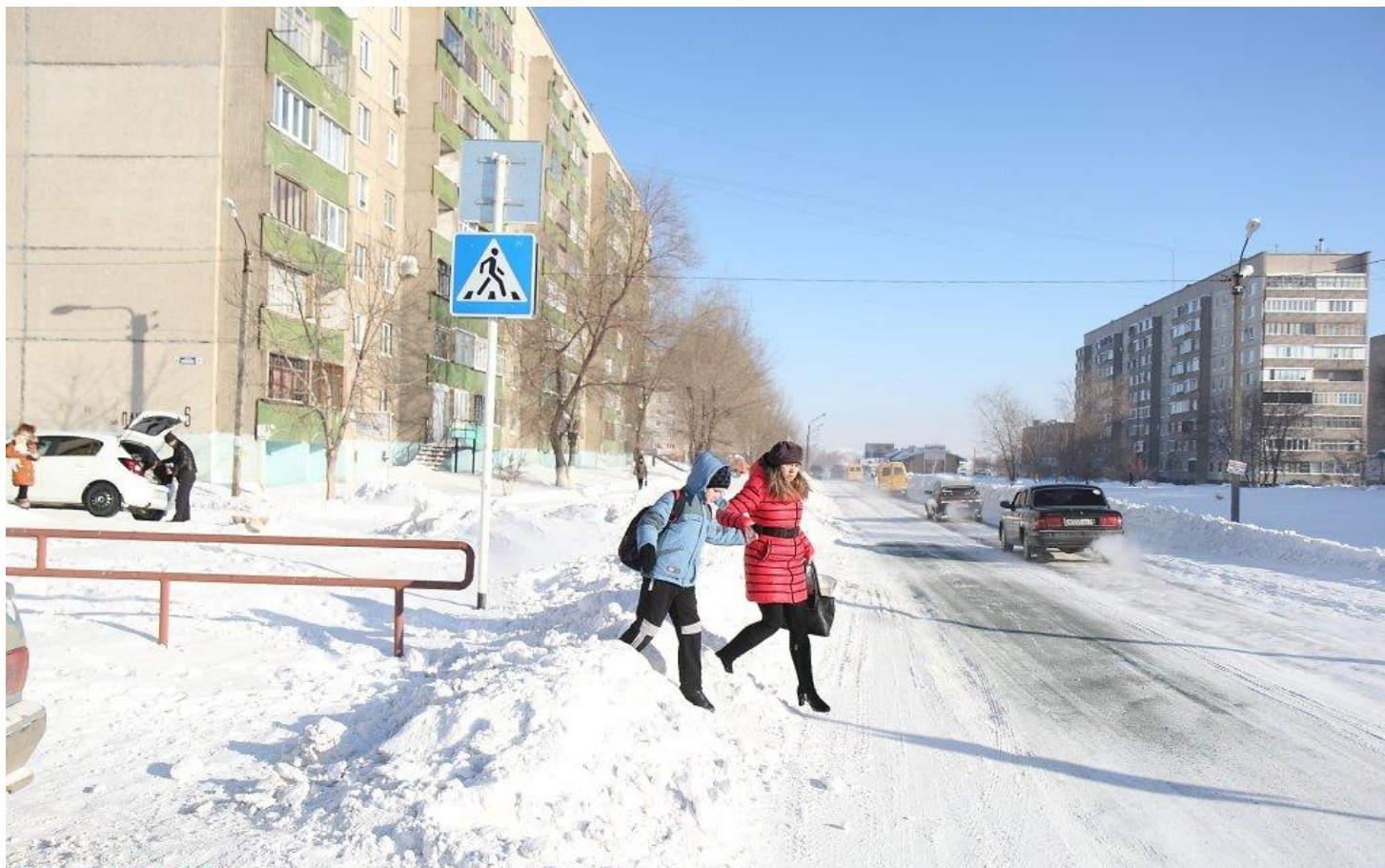
Проект для старшей группы