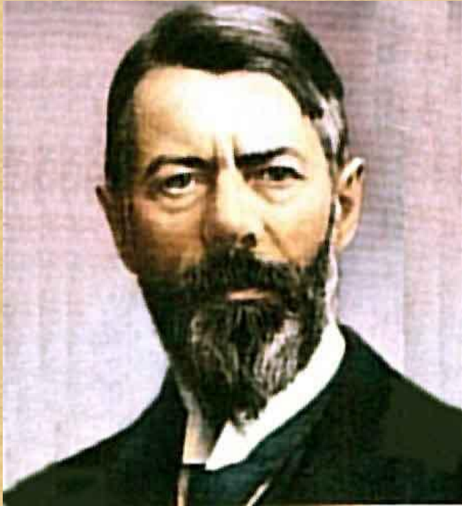
М.Вебер (1864-1920 гг.), немецкий социолог, экономист, юрист

«Действием называется человеческое поведение в том случае и постольку, если и поскольку действующий индивид или действующие индивиды связывают с ним субъективный смысл».