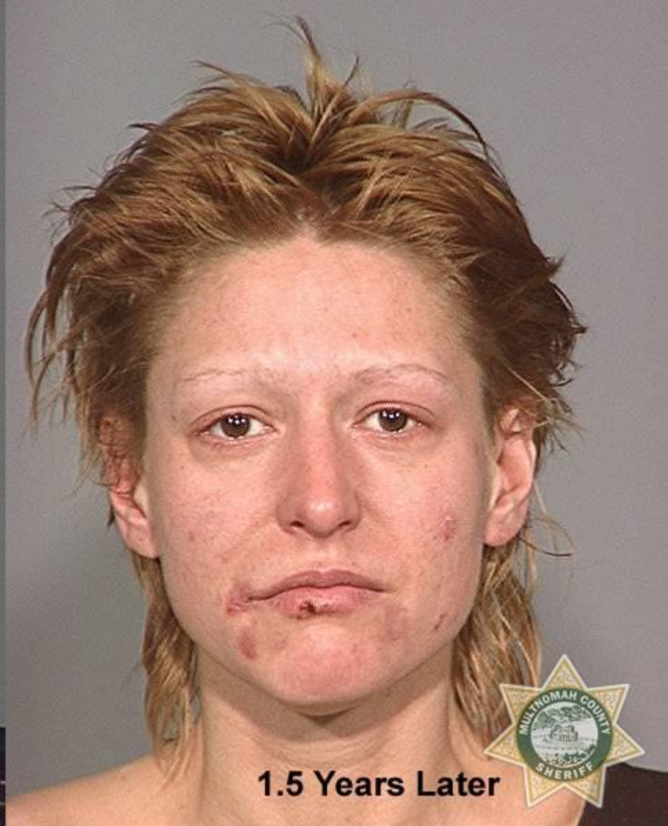
Через 1,5 года