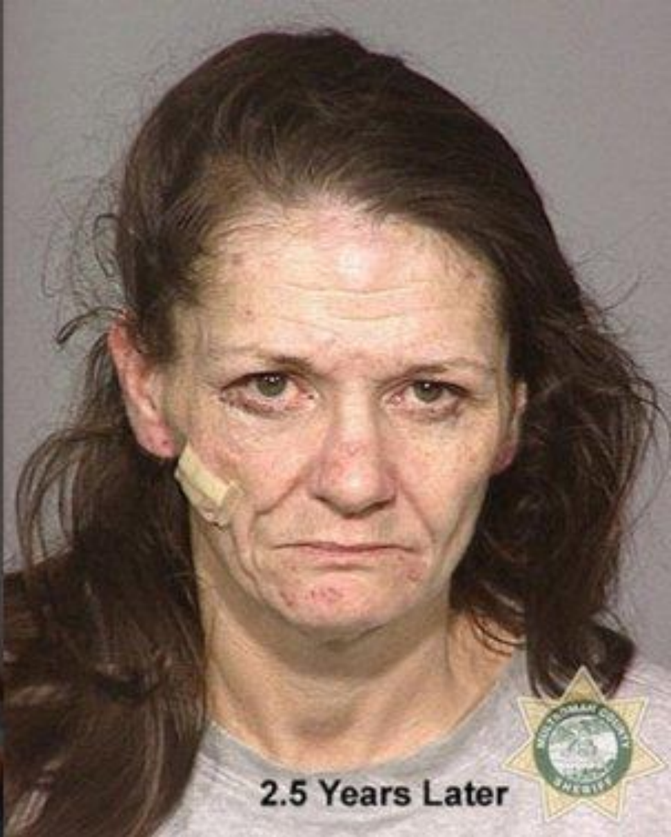
Через 2 года и 5 месяцев