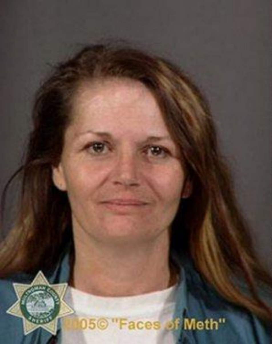
До приема наркотиков