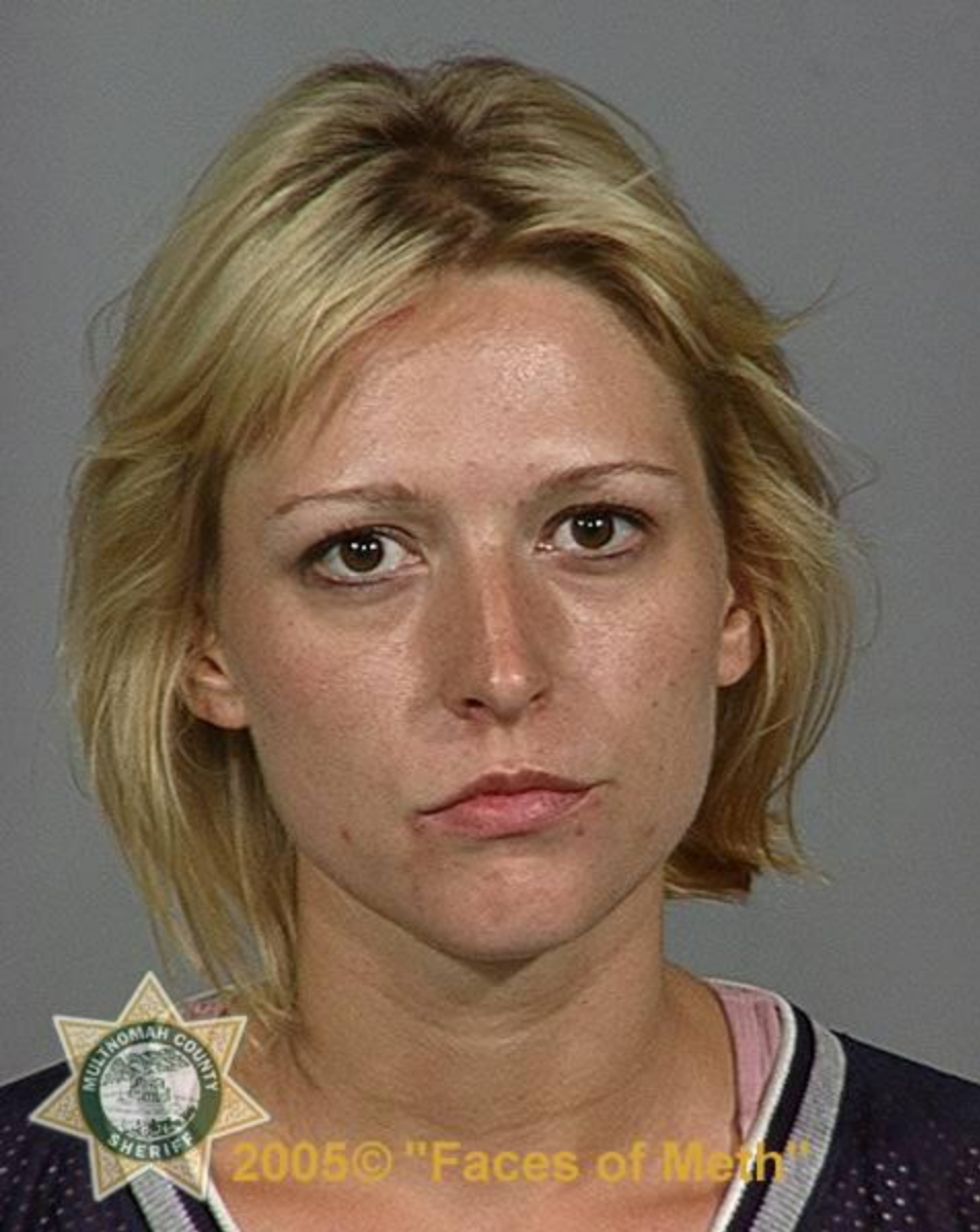
До приема наркотиков