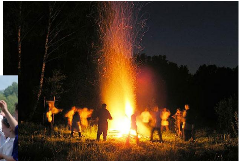
День Ивана Купала