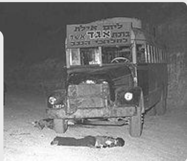
Бойня в Маале-Акробим