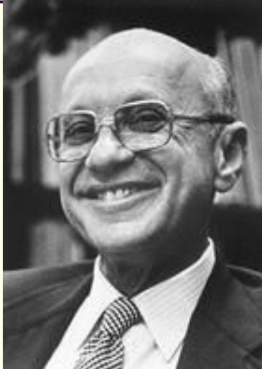
Милтон Фридмен (1912-2006) Milton Friedman