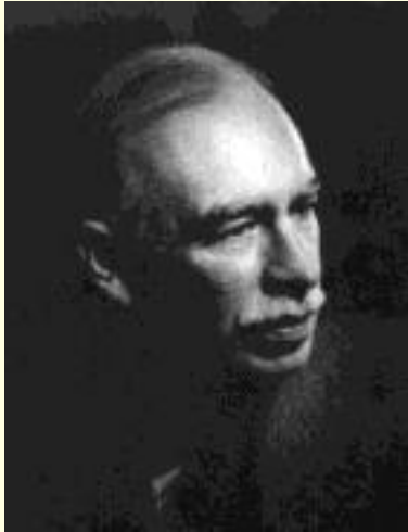
Джон Мейнард Кейнс (1883-1946)