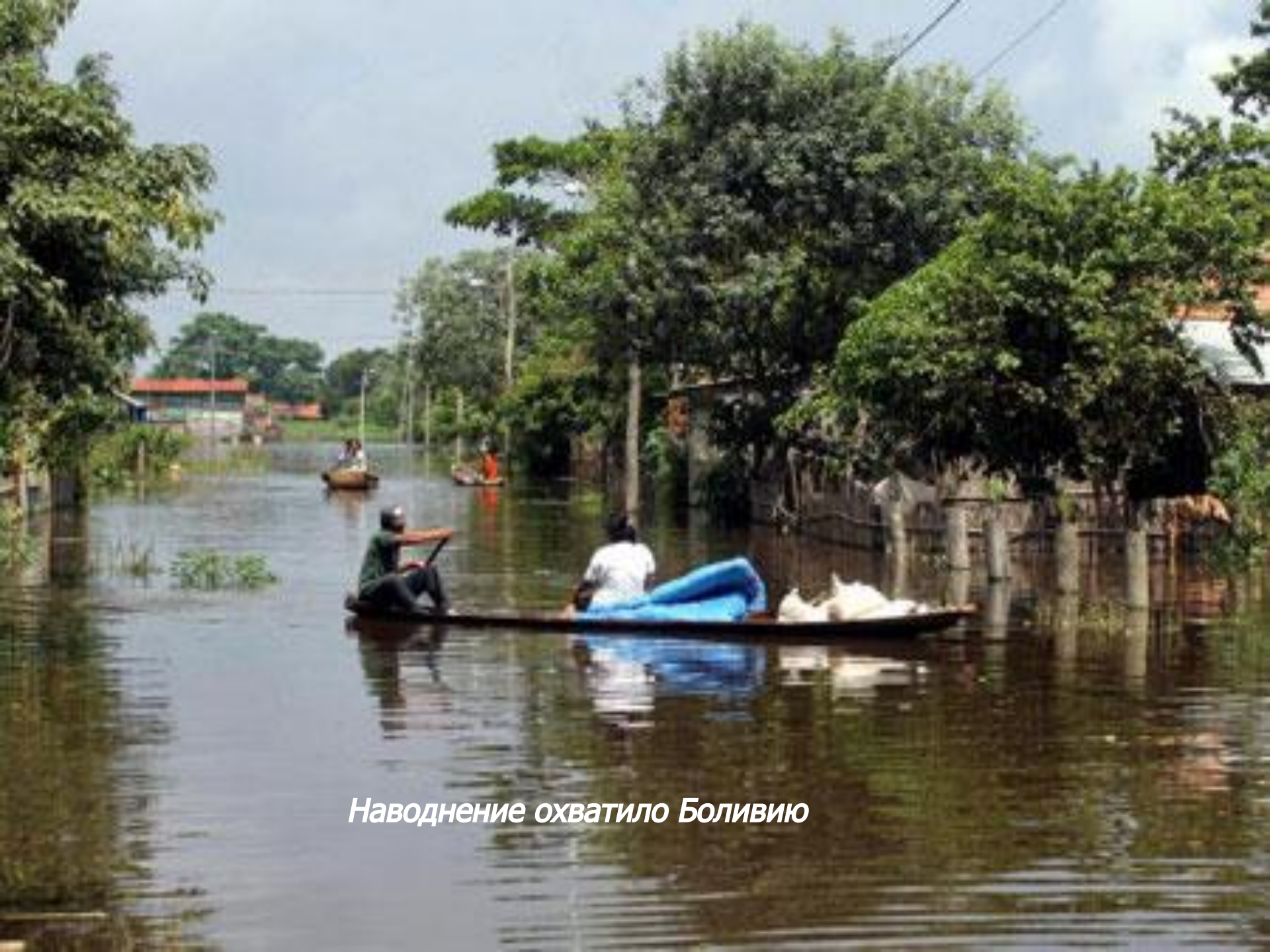
Наводнение охватило Боливию