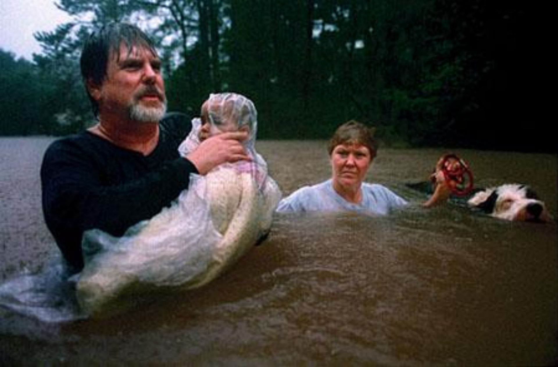
Наводнение в штате Техас, США.