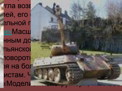
«Бронекolleкция» и др.