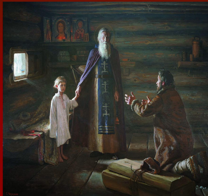
Воскрешение отрока Сергием