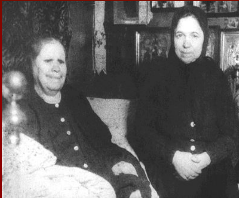
Святая блаженная старица Матрона

Древняя Русь всегда с почитанием относилась к блаженным на своей земле