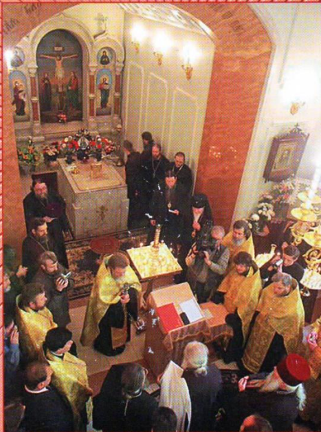
Молитва в часовне блаженной Ксении

Подвиги любви к ближним святая блаженная Ксения пронесла через всю свою многострадальную жизнь и получила любовь Божию в даре прозорливости и чудотворения, и любовь человеческую, которая не угасает уже второе столетие.