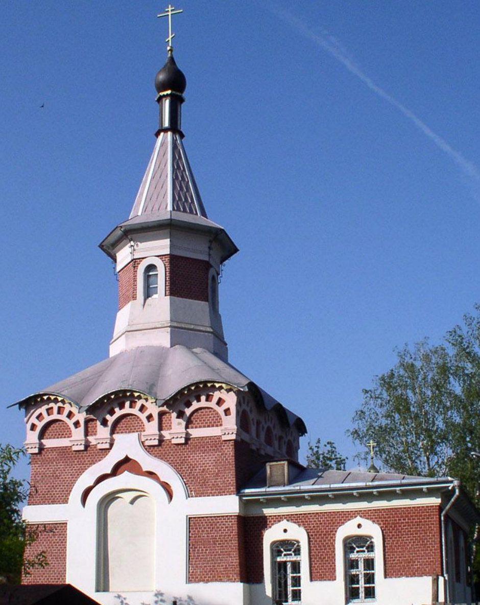
Часовня Ксении Петербургской