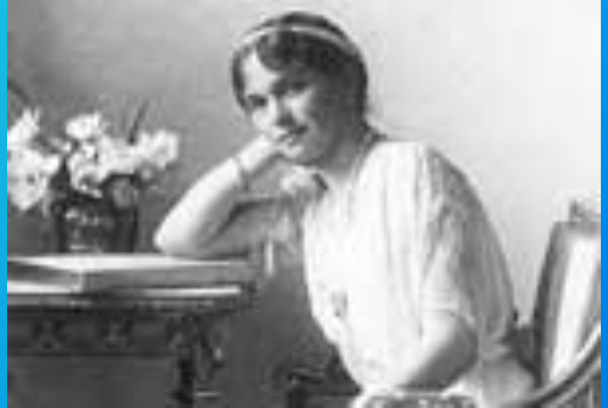
Великая Княжна Ольга

Пошли нам ,Господи, терпенье В годину буйных, мрачных дней, Сносить народное гоненье И пытки наших палачей. И у преддверия могилы Вдохни в уста Твоих рабов Нечеловеческие силы – Молиться кротко за врагов.