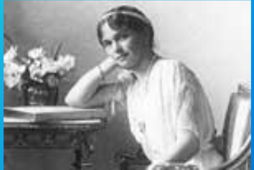
Великая Княжна Ольга

Пошли нам ,Господи, терпенье В годину буйных, мрачных дней, Сносить народное гоненье И пытки наших палачей. И у преддверия могилы Вдохни в уста Твоих рабов Нечеловеческие силы – Молиться кротко за врагов.