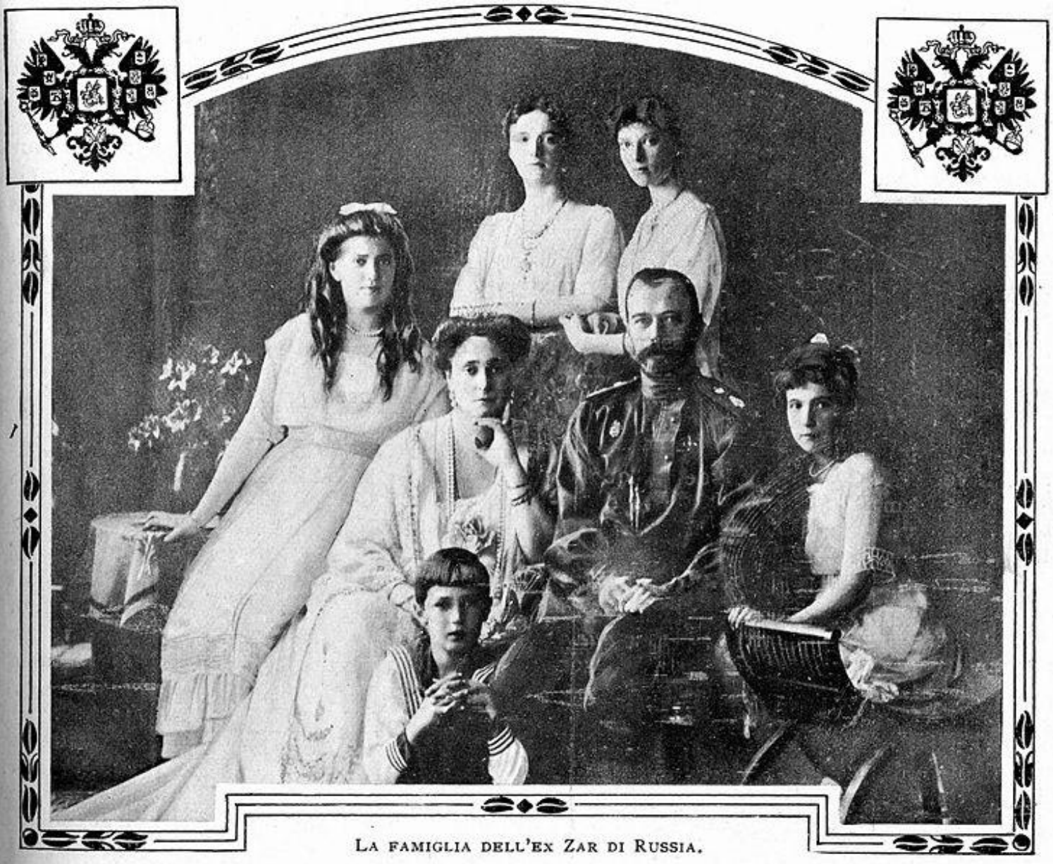
LA FAMIGLIA DELL'EX ZAR DI RUSSIA.