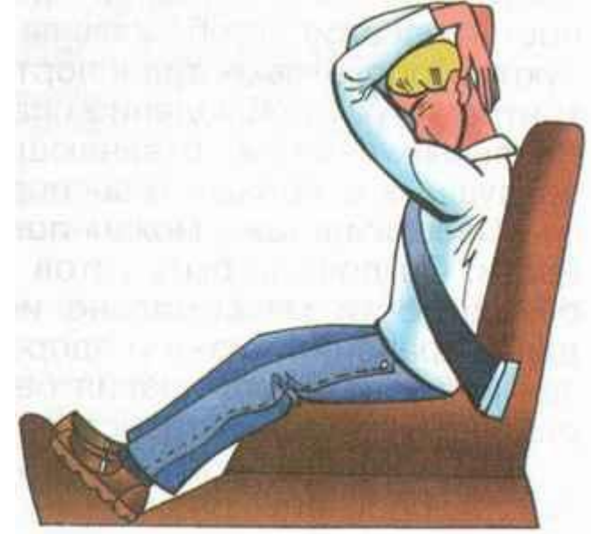
Безопасная поза при возможном столкновении автомобиля

Сильно напрягите все тело (мышцы), втяните голову в плечи. Расслабляться нельзя до полной остановки автомобиля.