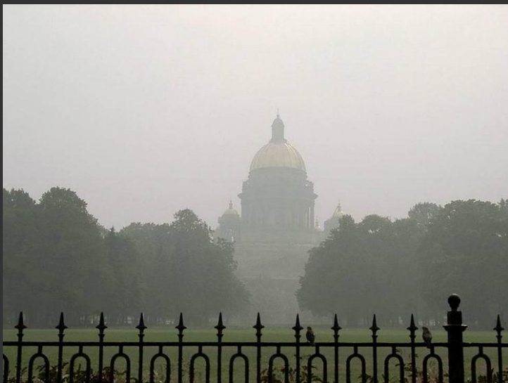
Белые ночи в Санкт-Петербурге.