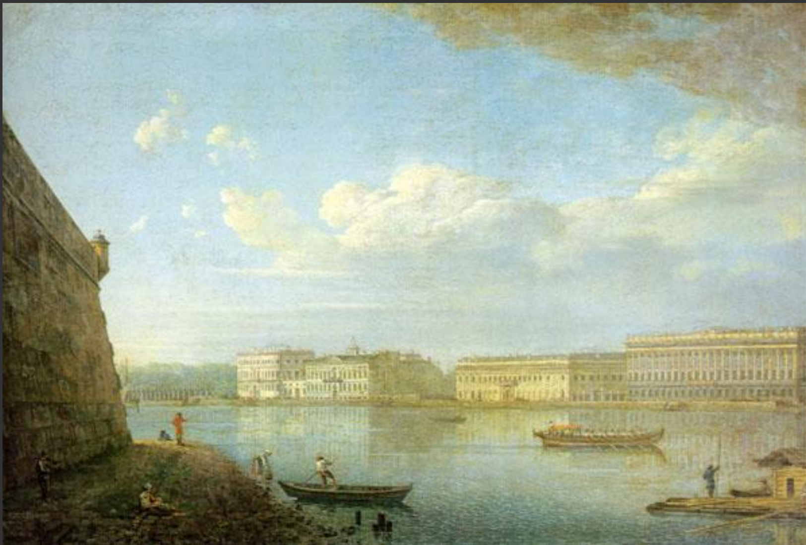
Ф. Алексеев. Вид Дворцовой набережной от Петропавловской крепости. 1794