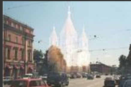
К. Тон. Благовещенская церковь. 1844–1849 Снесена в 1929

Второй аспект экологии культуры – сохранение целостности системы (экосистемы) культуры.