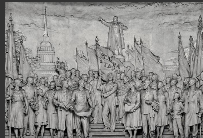
Горельеф на ст. метро «Нарвские ворота» в Санкт-Петербурге

Второй аспект экологии культуры – сохранение целостности системы (экосистемы) культуры.