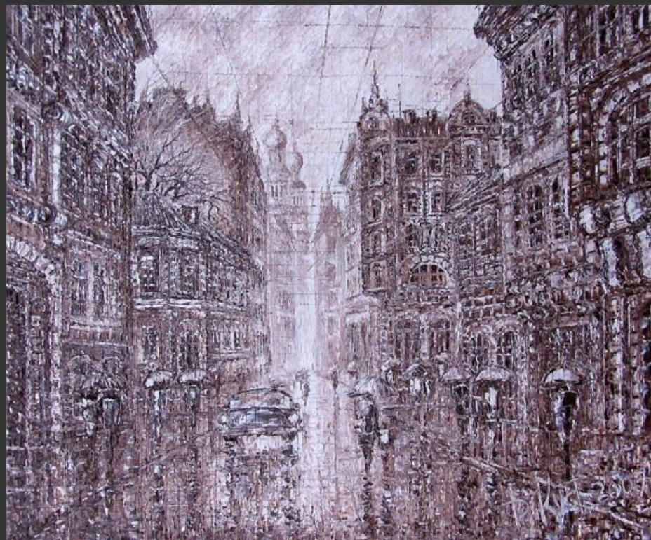
Д. Кустанович. Из серии «Городские дожди». 2006