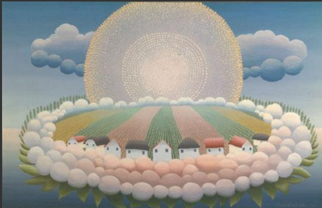
И. Рабузин. Мой мир

Для современного человека все большее значение, наряду с научным, приобретают теологическое, мифологическое и особенно художественное знание, обогащающее картину мира, делающее ее более глубокой, насыщенной и лично значимой.