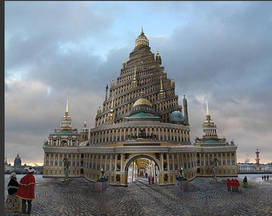
С. Полютин. Петербургский Вавилон. 2005