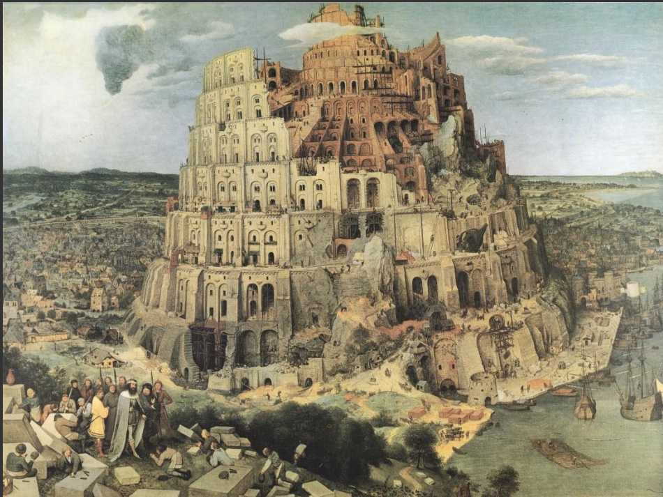
П. Брейгель Старший. Вавилонская башня. 1654

Очевидно, сколько зрителей – столько версий, гипотез, предположений, прочтений картины.