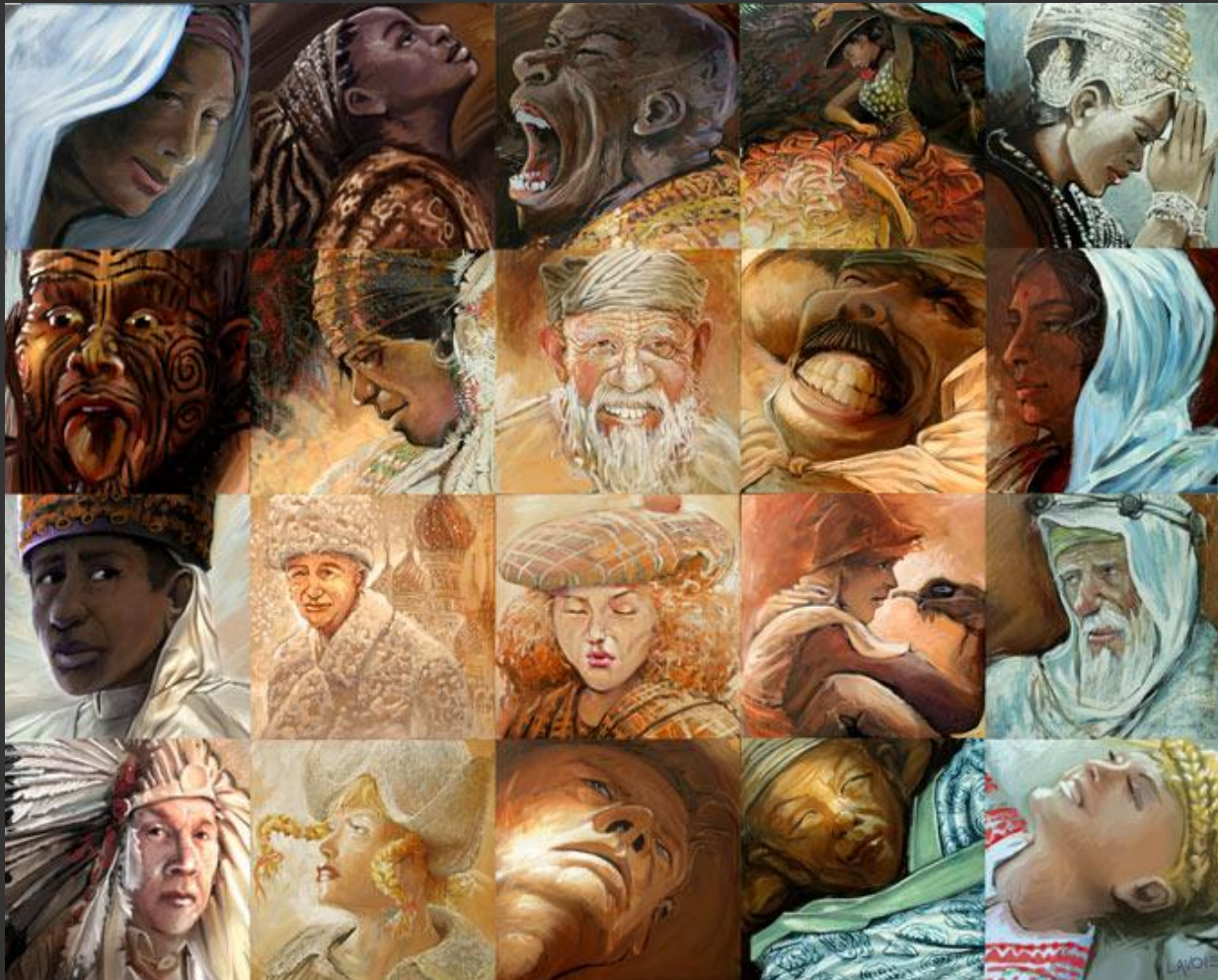
Л. Лаво. Адам. Одна кровь, много национальностей. 1997

Пространство культуры включает все сущее: шедевры и массовую продукцию, артефакты прошлого и настоящего, «предметы» почитания миллионов и вещи, наделенные ценностью лишь для одного. Но, несмотря на пестроту и неоднородность всех компонентов культуры, она – органична и целостна.