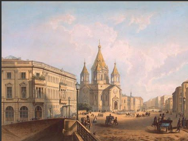
И. Шарлемань. Вид на Благовещенскую церковь с Благовещенского моста. 1850