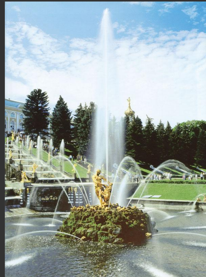
Б. Растрелли. Фонтан «Самсон» в Петергофе. 1730-е