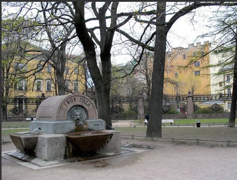
Т. де Томон Фонтан в сквере перед Казанским собором 1809

Первый аспект экологии культуры – сохранение культурной среды, созданной предшествующими поколениями людей.