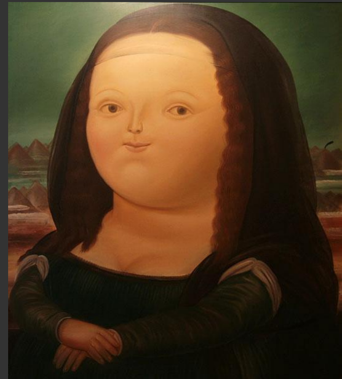
Ф. Ботеро. Мона Лиза. 1977