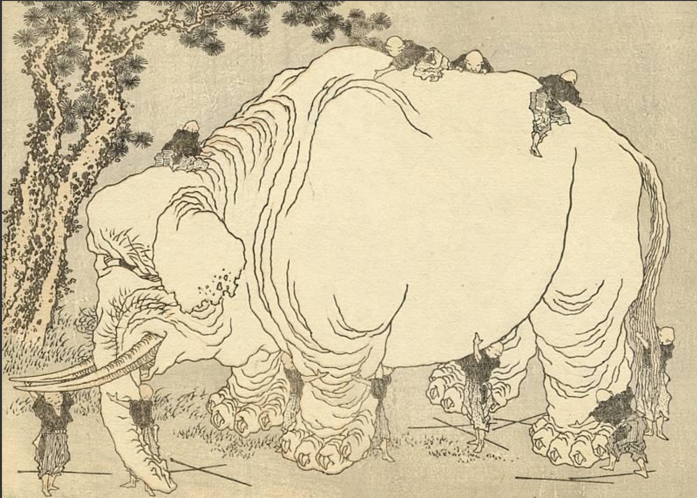
Кацусика Хокусай. Слепцы и слон. 1814

Третий аспект экологии культуры – сохранение единства смыслового поля культуры.