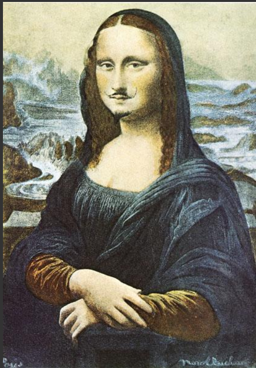
М. Дюшан. L.H.J.J.Q. 1919

Любой объект культуры несет в себе множественные разнообразные значения, и их «прочтение» зависит лишь от индивидуального опыта личности, уровня общей культуры – кругозора и контекста восприятия. Современная культура толерантна и допускает множественные толкования смыслов и значений одного и того же объекта.