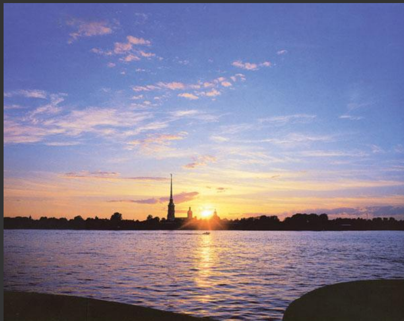
Петропавловская крепость. XVIII в.

Первый аспект экологии культуры – сохранение культурной среды, созданной предшествующими поколениями людей.