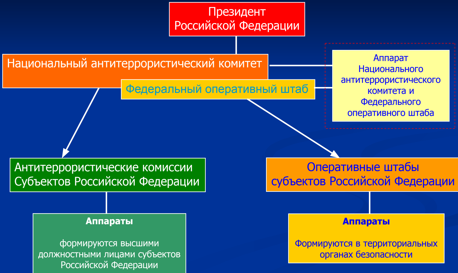
Схема координации деятельности по противодействию терроризму в Российской Федерации