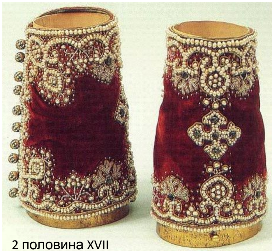
2 половина XVII века

Поверх епитрахили и подризника священники надевают специальный пояс , имеющий несколько символических значений, в том числе напоминание о полотенце, которым препоясался Иисус Христос, когда омывал ноги своим ученикам.