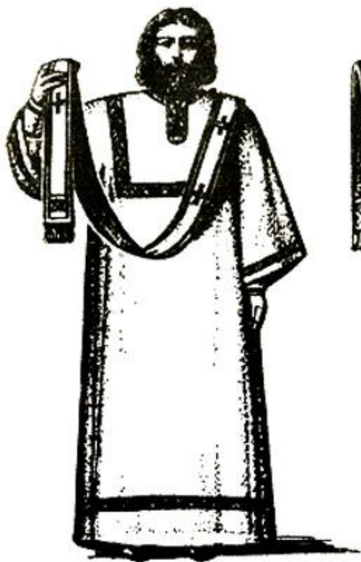
Діаконъ въ облаченіи