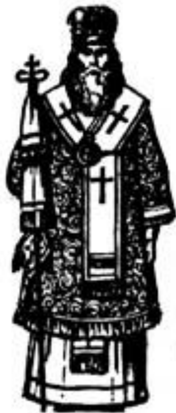
Епископъ въ облаченіи.