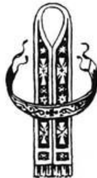
Епитрахиль и пояс

На руки священник надевает специальные поручи - узкие нарукавники, стягивающиеся шнурками. Символически они отождествляются с веревками на руках Иисуса Христа.