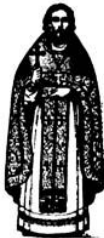
Священникъ въ облаченіи.