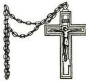
Наградн. золот. Крестъ