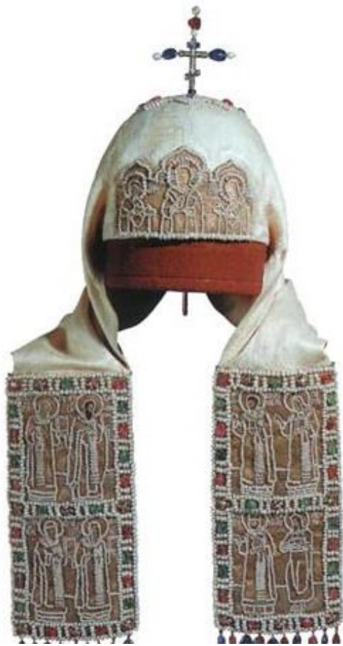
Белый клобук патриарха Никона

Монашествующие носят клобуки – камилавки, обтянутые черным крепом, спускающимся на спину в виде трех концов.