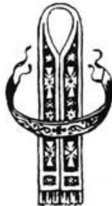
Епитрахиль и пояс

На руки священник надевает специальные поручи - узкие нарукавники, стягивающиеся шнурками. Символически они отождествляются с веревками на руках Иисуса Христа.