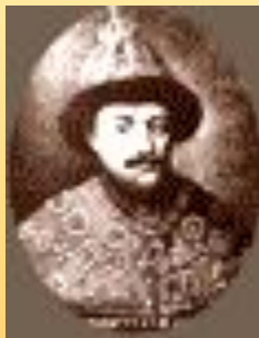
Царь Алексей Михайлович

30 апреля царь Алексей Михайлович издаёт «Наказ о градском благочинии» - первый общегосударственный документ, сформулировавший организацию мер по пожарной безопасности.