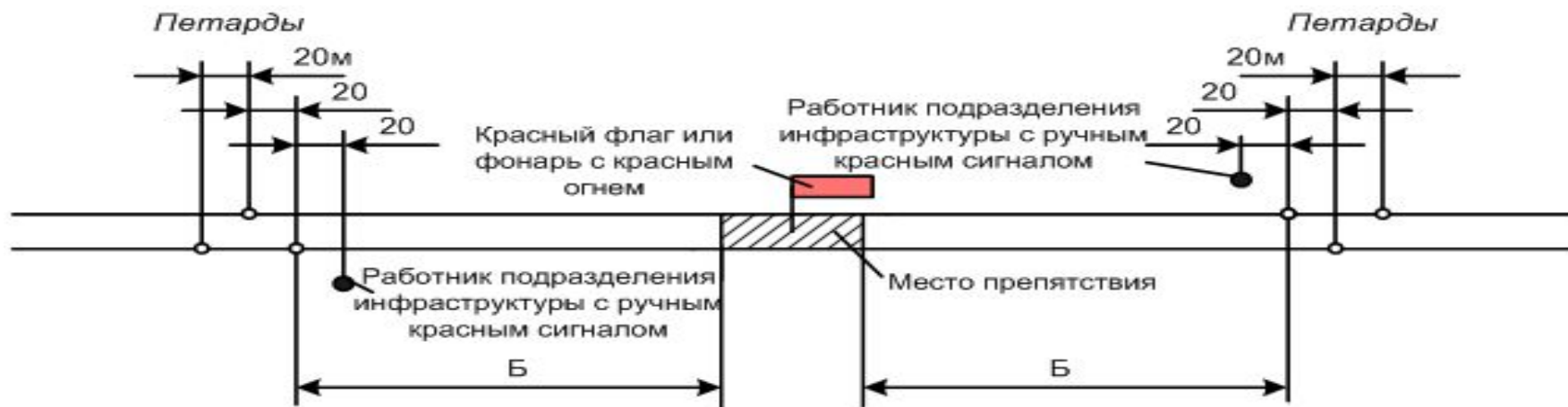
Схема ограждения мест внезапно возникшего препятствия для движения поездов.

Если на сигнал тревоги явится работник ж.д. транспорта, то после установки сигнала остановки на месте препятствия они идут укладывать петарды на расстоянии «Б» и далее остаются у петард в ожидании поезда.