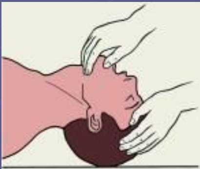
Рис.1 Положение головы больного при проведении искусственной вентиляции легких по способу изо рта в рот или изо рта в нос.

в) по сравнению с другими приемами обеспечивает больший объем поступающего воздуха в легкие пострадавшего.