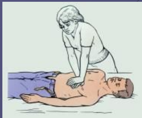
Рис. 5 Положение больного и оказывающего помощь при непрямом массаже сердца.