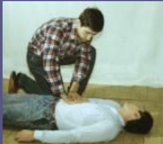
Рис. 7. Освобождение желудка пострадавшего от воздуха путем надавливания на эпигастральную (подложечную) область.