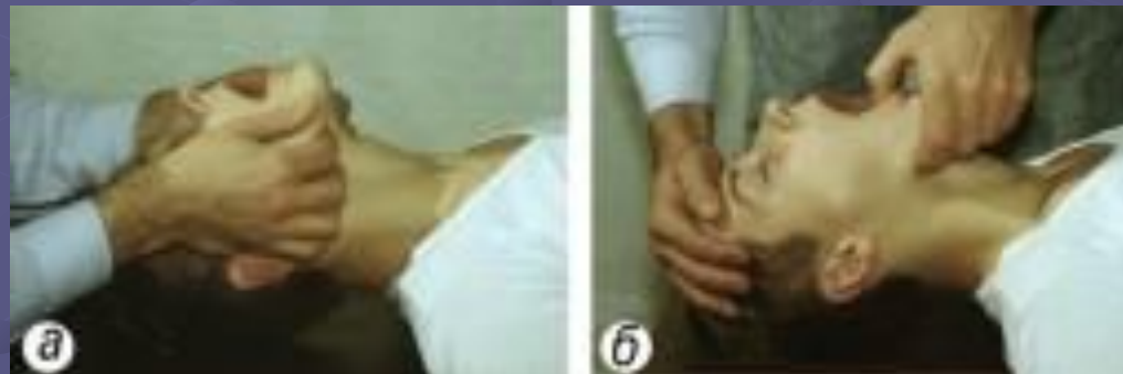
Рис. 2 Подготовка к проведению искусственного дыхания: выдвигают нижнюю челюсть вперед (а), затем переводят пальцы на подбородок и, оттягивая его вниз, раскрывают рот; второй рукой, помещенной на лоб, запрокидывают голову назад (б).