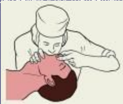
Рис. 3 Искусственная вентиляция легких по способу изо рта в рот.