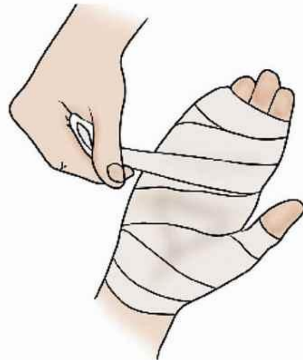
Затем наложить повязку и отправиться к врачу