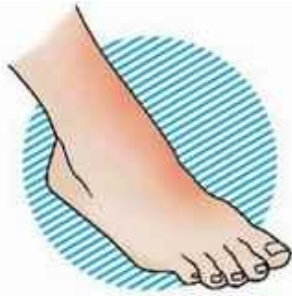
I степень – покраснение кожных покровов