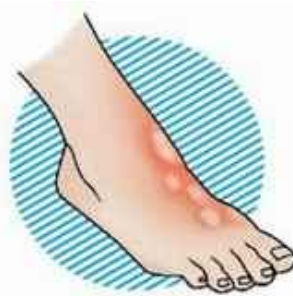
II степень – образование пузырей на коже