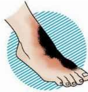
III–IV степень – обугливание кожи и тканей (до кости)