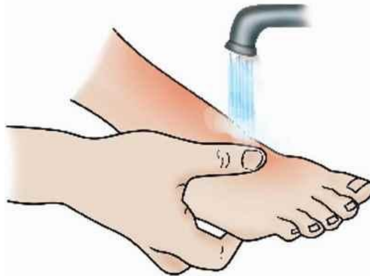
Ожоги лучше промыть холодной водой...