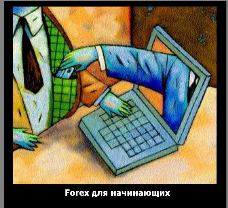
Forex для начинающих