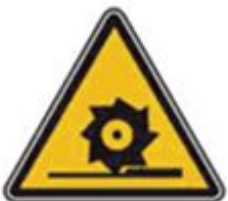
362 Осторожно. Режущие валы