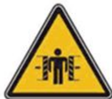
363 Внимание. Опасность зажима