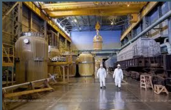
предприятия по переработке или изготовлению ядерного топлива