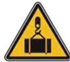
347 Опасно. Возможно падение груза