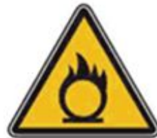
352 Опасно. Окислитель