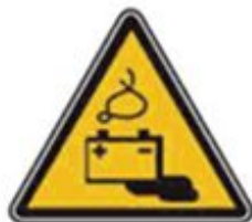
361 Осторожно. Аккумуляторные батареи