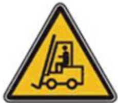
348 Внимание. Автопогрузчик