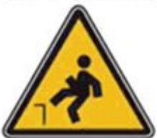
356 Осторожно. Возможность падения с высоты