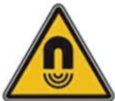
354 Внимание. Магнитное поле