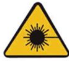
351 Опасно. Лазерное излучение