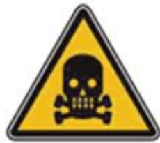
344 Опасно. Ядовитые вещества