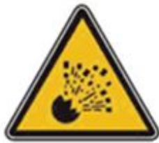
343 Опасно. Взрывоопасно