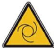
365 Внимание. Автоматическое включение (запуск) оборудования