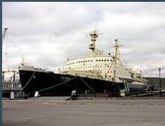
ядерные энергетические установки на транспорте.