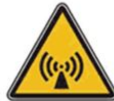
353 Внимание. Электромагнитное поле