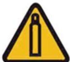
360 Газовый балон