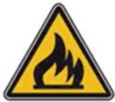
342 Опасно. Легковоспламеняющиеся вещества