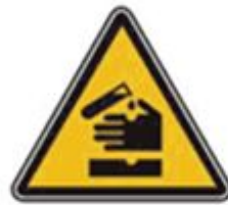
345 Опасно. Едкие и коррозионные вещества