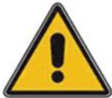
350 Внимание. Опасность (прочие опасности)