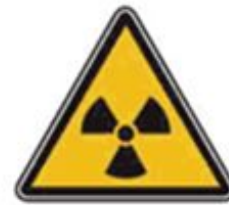
346 Опасно. Радиоактивные вещества или ионизирующее излучение