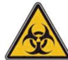
357 Осторожно. Биологическая опасность (Инфекционные вещества)