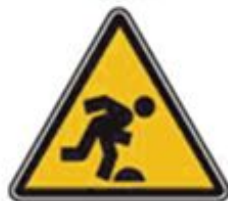
355 Осторожно. Малозаметное препятствие