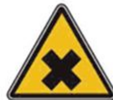
359 Осторожно. Вредные для здоровья аллергические (раздражающие) вещества