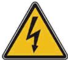
349 Опасность поражения электрическим током