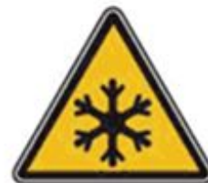
358 Осторожно. Холод