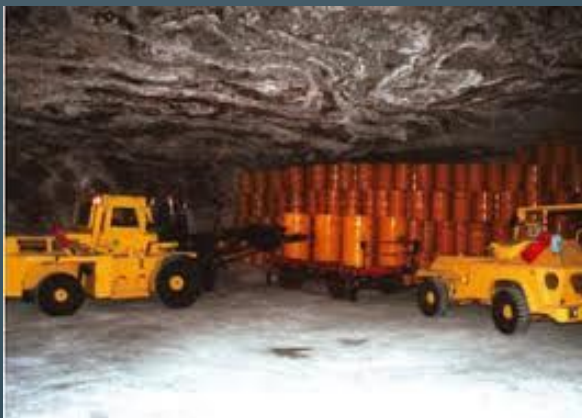
предприятия по захоронению радиоактивных отходов