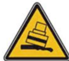
364 Осторожно. Возможность опрокидывания