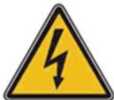
349 Опасность поражения электрическим током