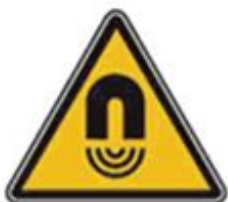
354 Внимание. Магнитное поле