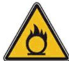
352 Опасно. Окислитель