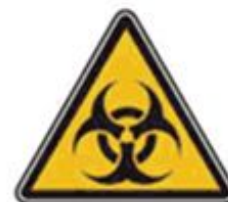
357 Осторожно. Биологическая опасность (Инфекционные вещества)