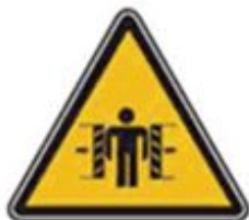
363 Внимание. Опасность зажима