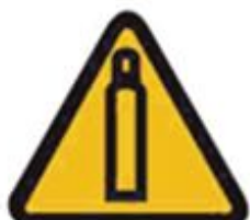
360 Газовый балон