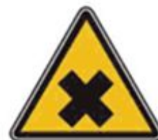
359 Осторожно. Вредные для здоровья аллергические (раздражающие) вещества