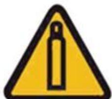
360 Опасно. Газовый баллон