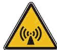
353 Внимание. Электромагнитное поле