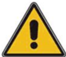
350 Внимание. Опасность (прочие опасности)