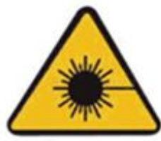
351 Опасно. Лазерное излучение