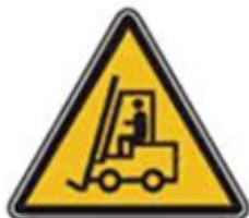
348 Внимание. Автопогрузчик