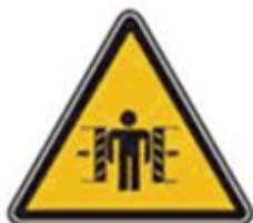
363 Внимание. Опасность зажима