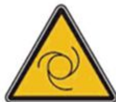
365 Внимание. Автоматическое включение (запуск) оборудования