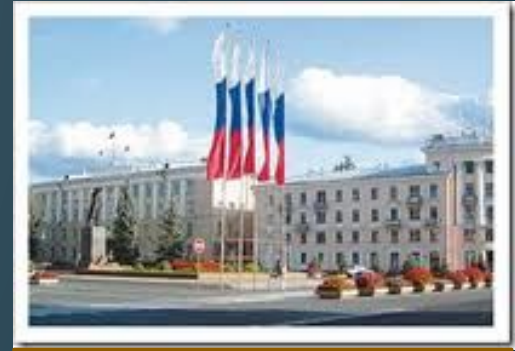
научно- исследовательские и проектные организации