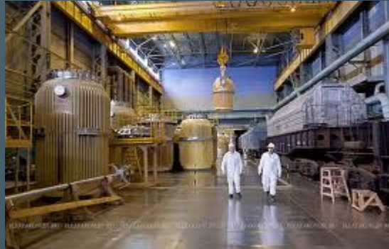
предприятия по переработке или изготовлению ядерного топлива