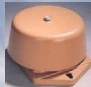
Звонки громкого боя и электросирены