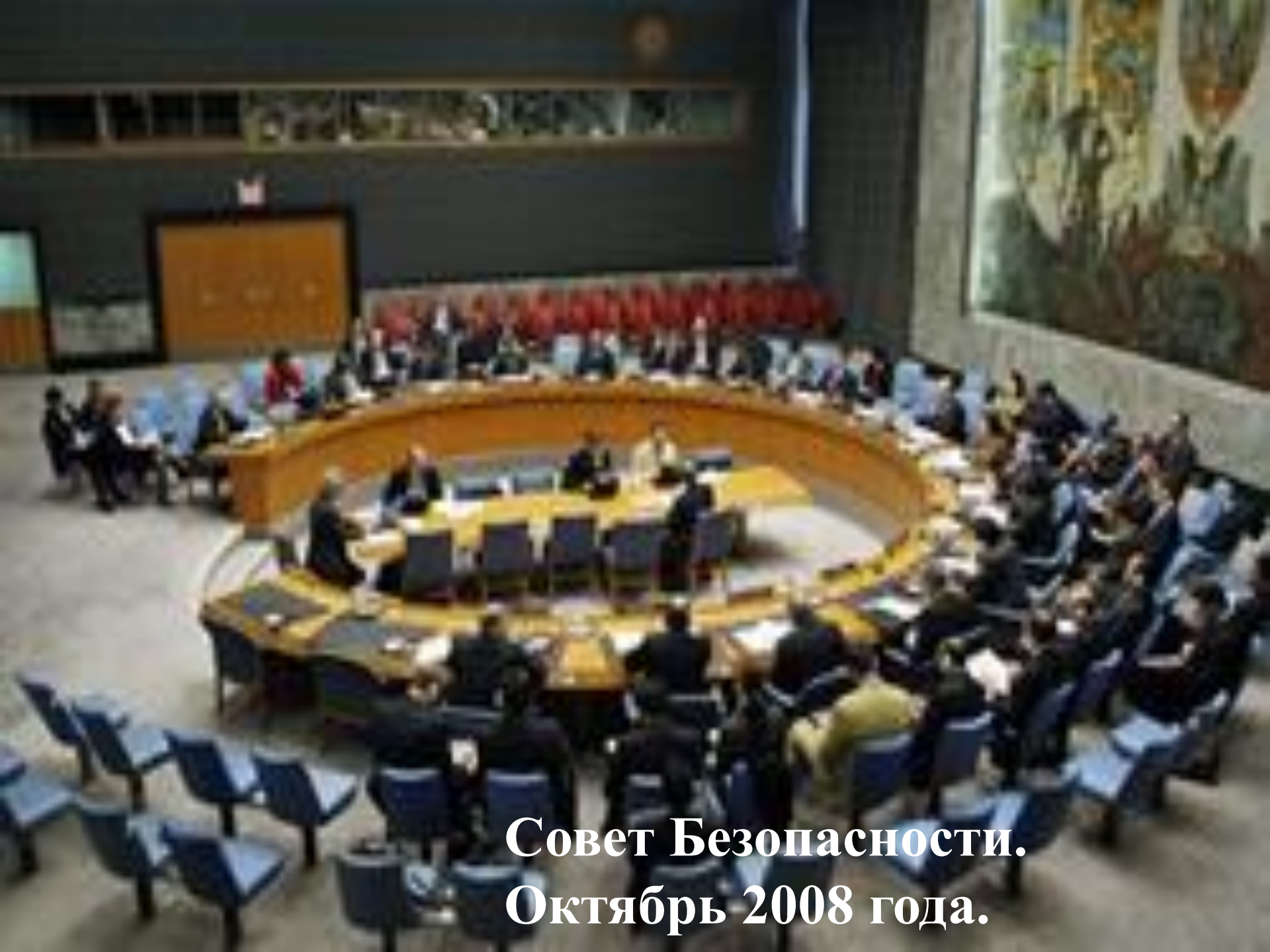
Совет Безопасности. Октябрь 2008 года.