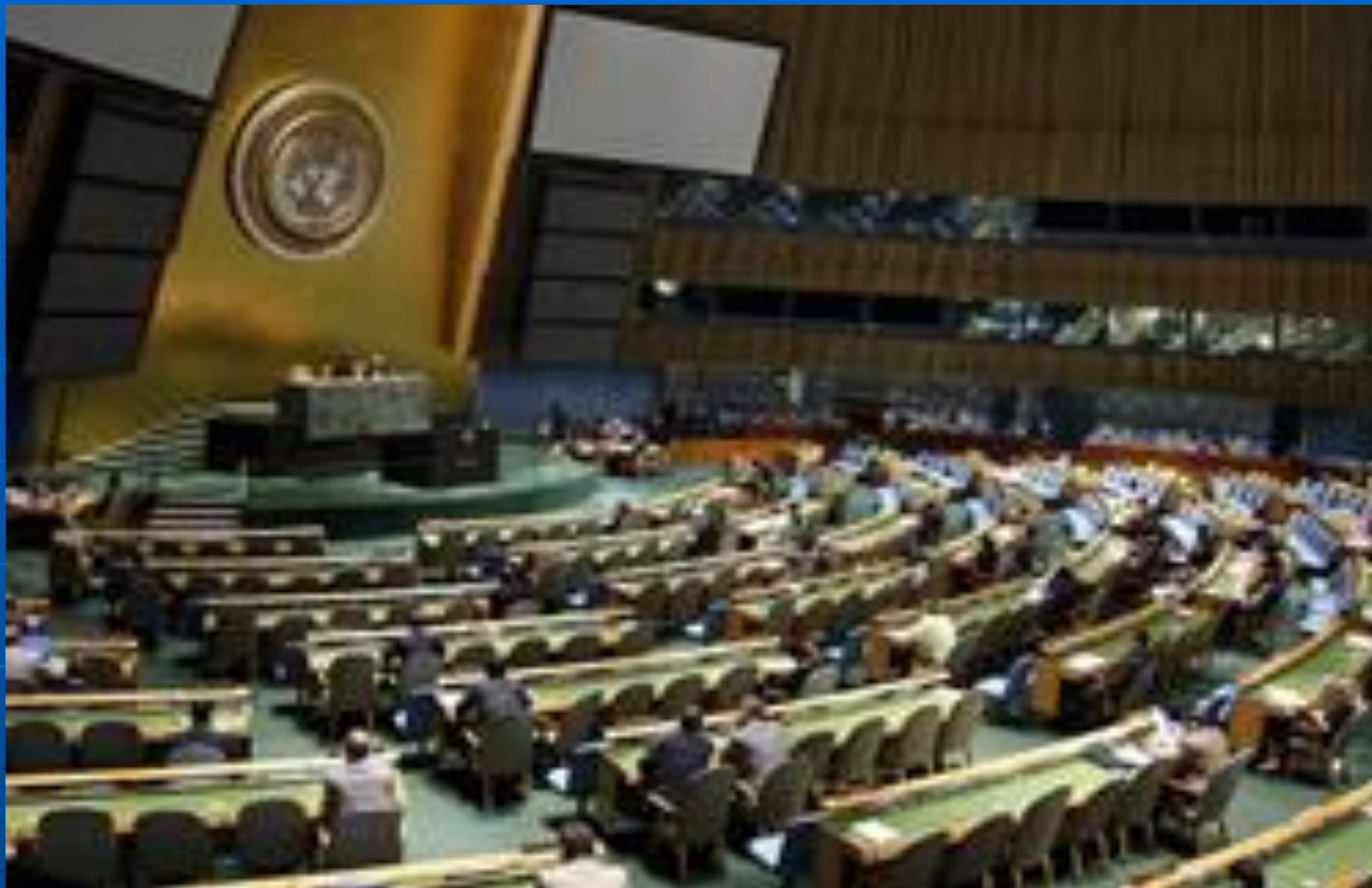
Сессия Генеральной Ассамблеи. Июль 2008 года.