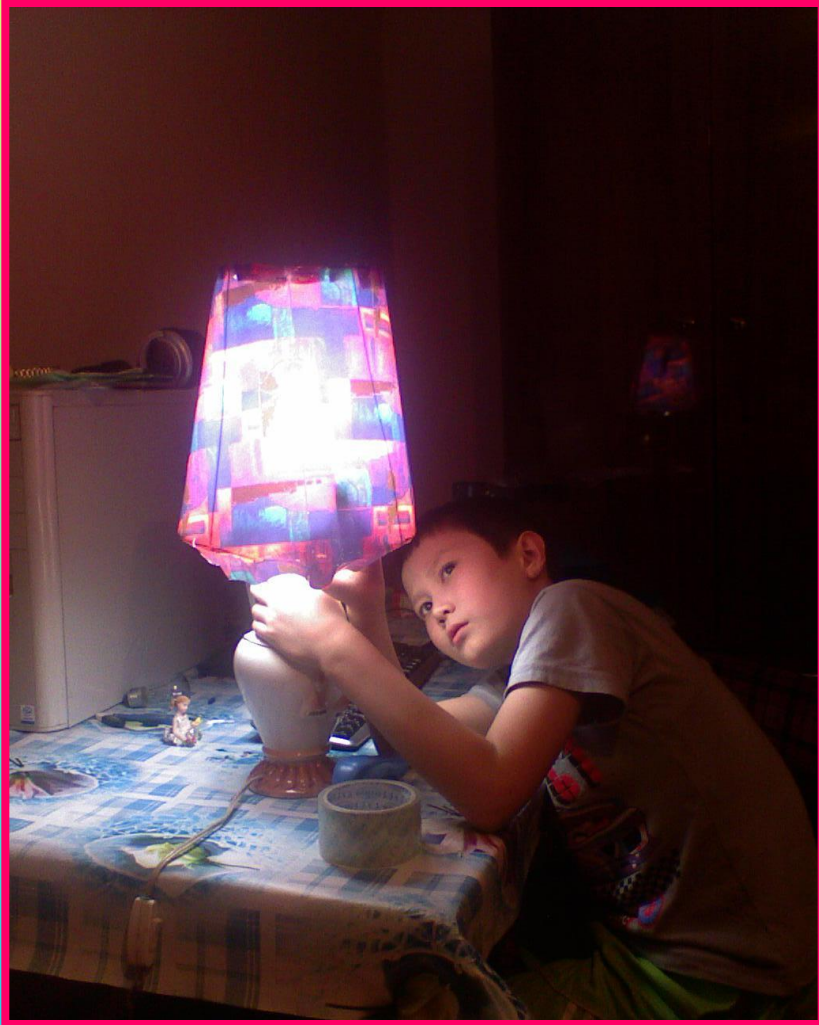
Проверка устойчивости абажура