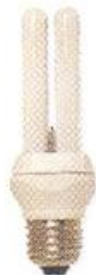
С резь- бовым цоколем