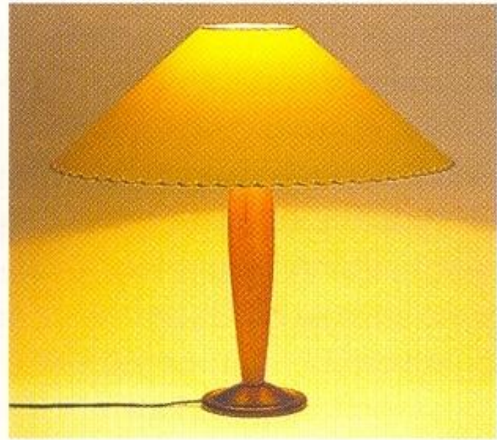
Деревянная подставка и бумажный абажур