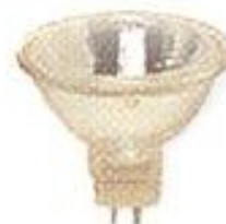
Миниатюр- ный низко- вольтный рефлектор