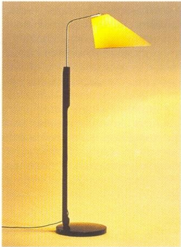
Бронзовый торшер с бумажным абажуром

Помимо общего освещения нужны лампы для чтения: они должны быть достаточно яркими, но свет давать направленный, поэтому абажуры у таких ламп не бывают прозрачными.