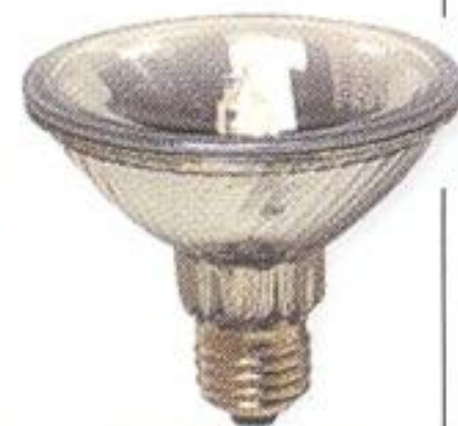
Рефлектор на 220 В