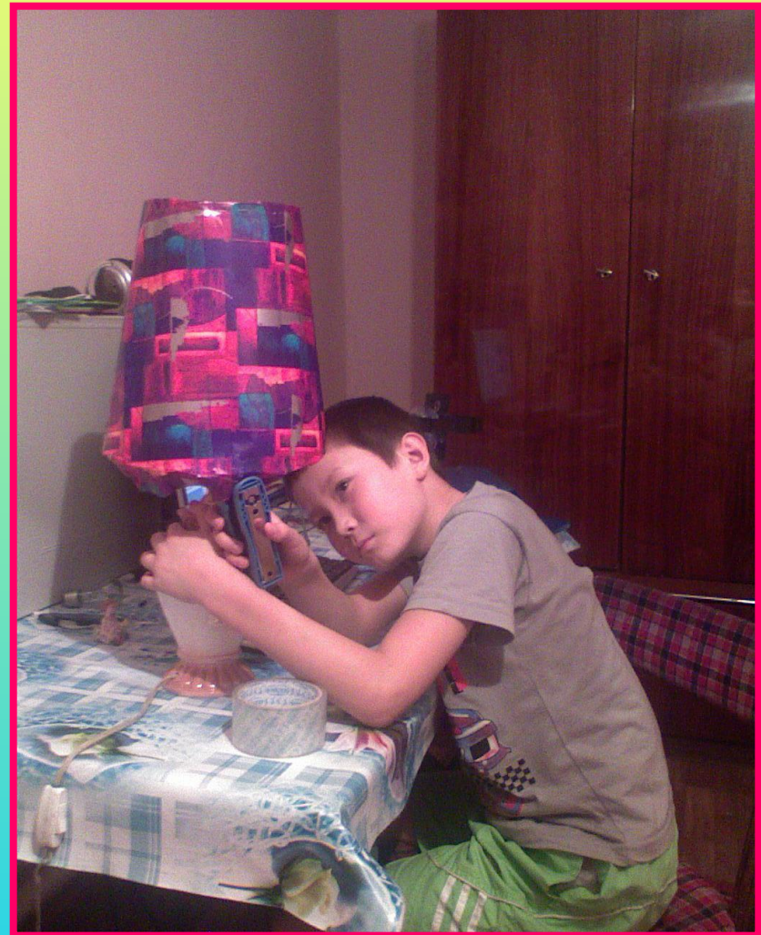
Закрепление скобами и обрезка