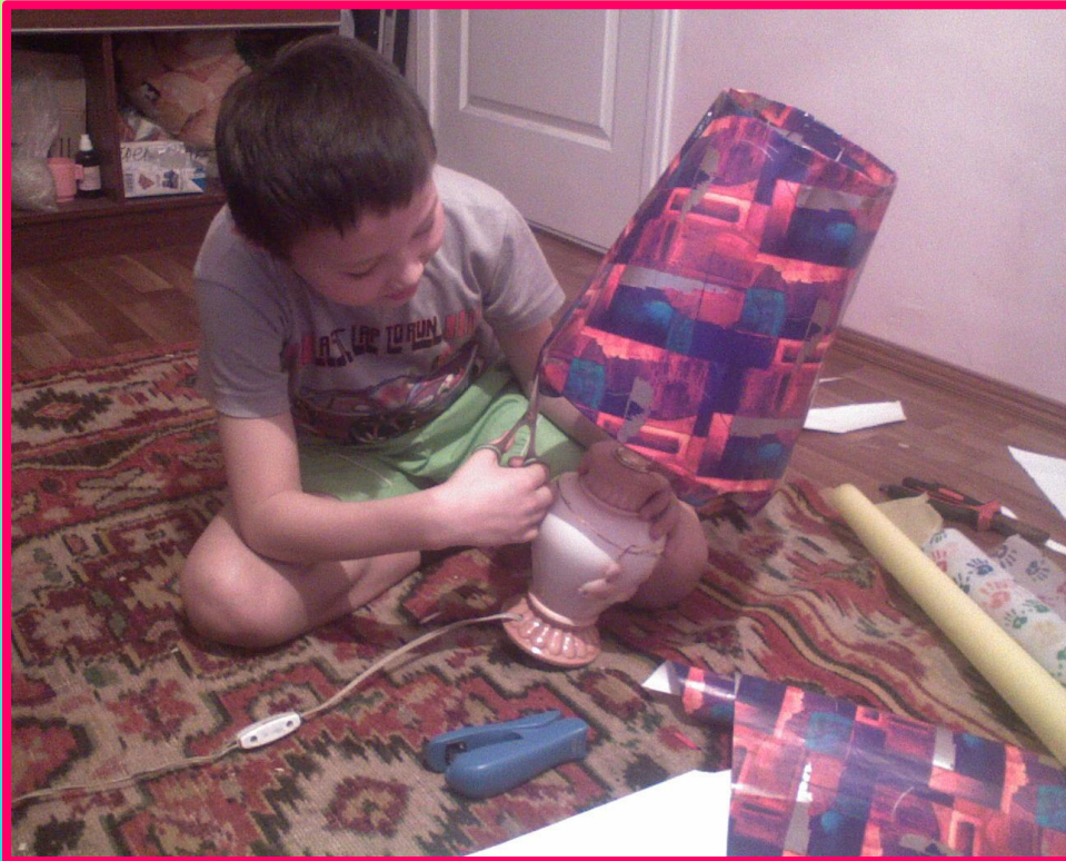
Натягивание бумаги на каркас