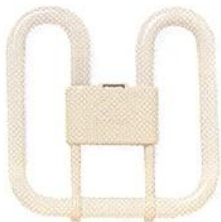
Миниатюрная плоская лампа