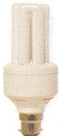
С байонетным цоколем