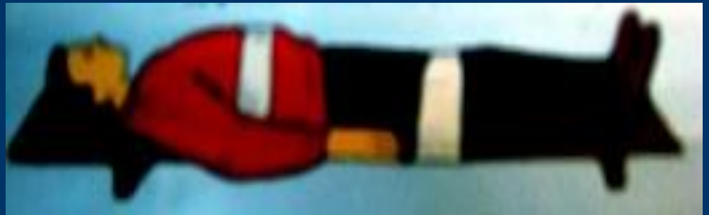
Пример иммобилизации позвоночника